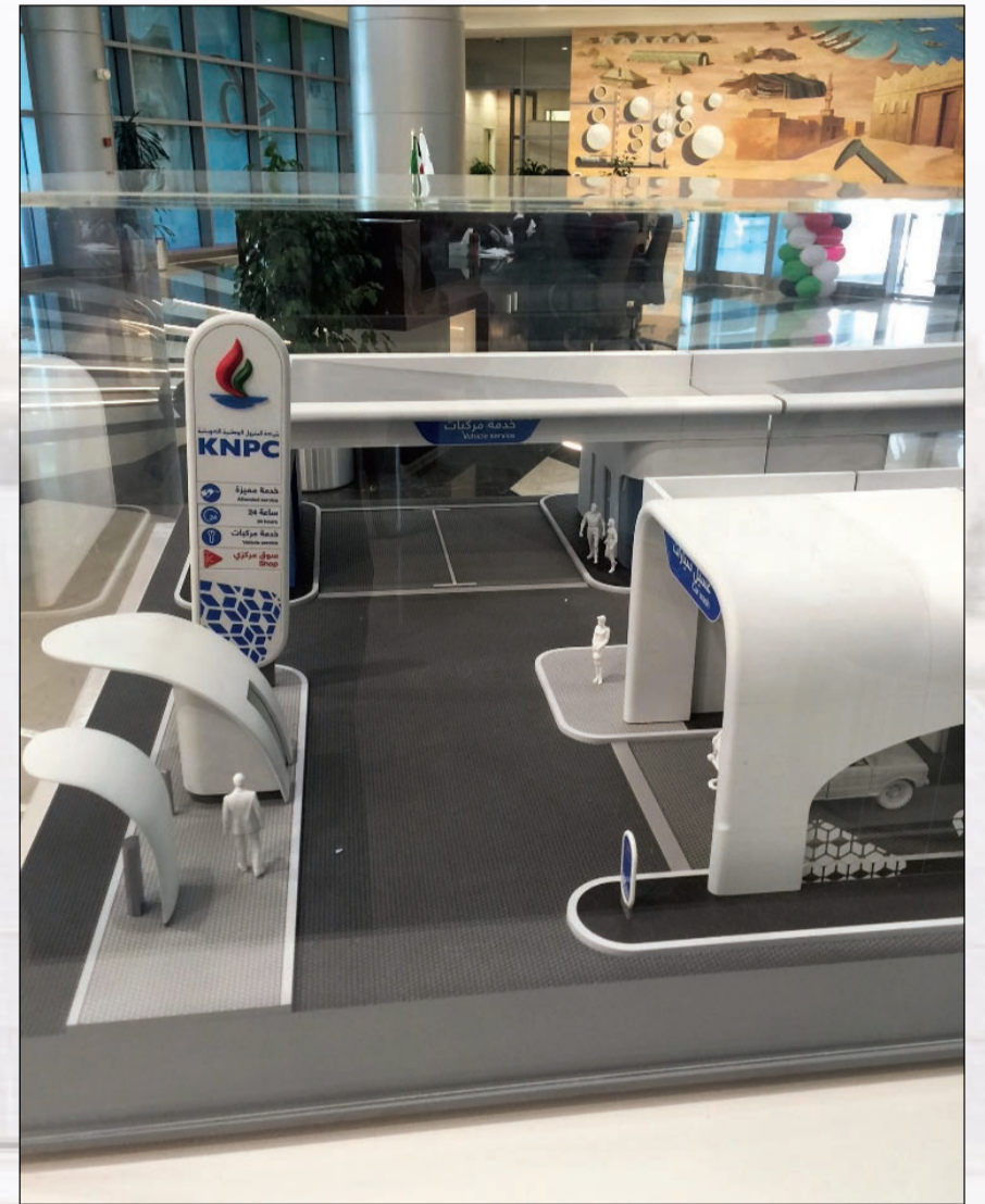
صورة جانبية لمحطة الوقود الجديدة