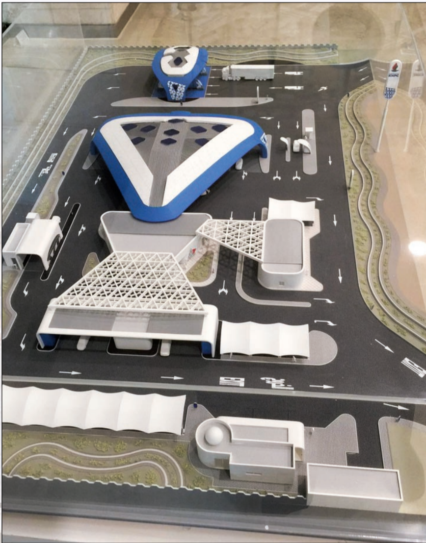
ماكيت يوضح محطة الوقود والخدمات غير البترولية المقدمة للزبائن

• طرح مزايمة لتوفير خدمات المطاعم والتسوق في 5 محطات • افتتاح محطتي شارع الغزالي والدوحة مايو المقبل