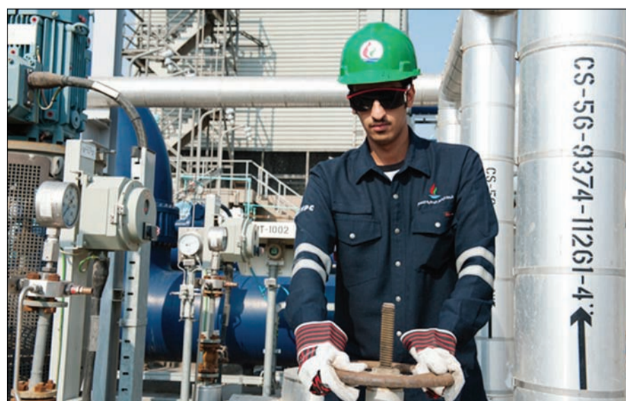
هل الكويت بحاجة لشركة جديدة لإدارة مشاريع تابعة لشركات منضوية تحت مظلة «مؤسسة البترول»؟

1 - تعظيم إيرادات مصفاة الزور لأنها استراتيجية. 2 - إعطاء مجال للمشارك الخاص والمواطنين للمشاركة في المشاريع النفطية الجديدة.