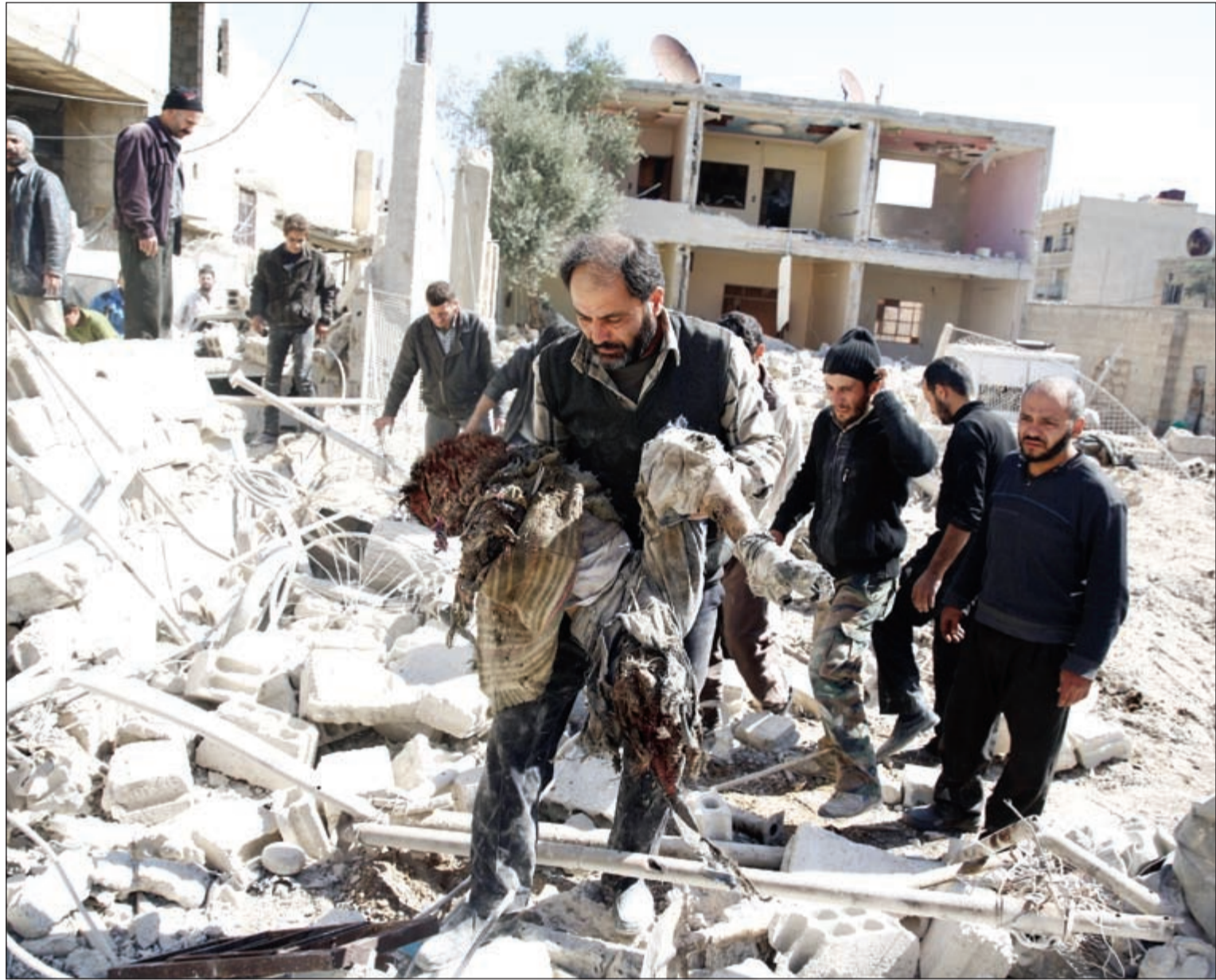
أعضاء لجنة الهلال الأحمر العربي السوري يستخرجون جثثاً من تحت الأنقاض عقب غارة جوية روسية بدوما في الغوطة الشرقية

وقال بوتين خلال اجتماع مع أجهزة الاستخبارات الروسية «أود أن أوضح مرة جديدة أن تنظيم داعش وجبهة النصرة والتنظيمات الإرهابية الأخرى التي