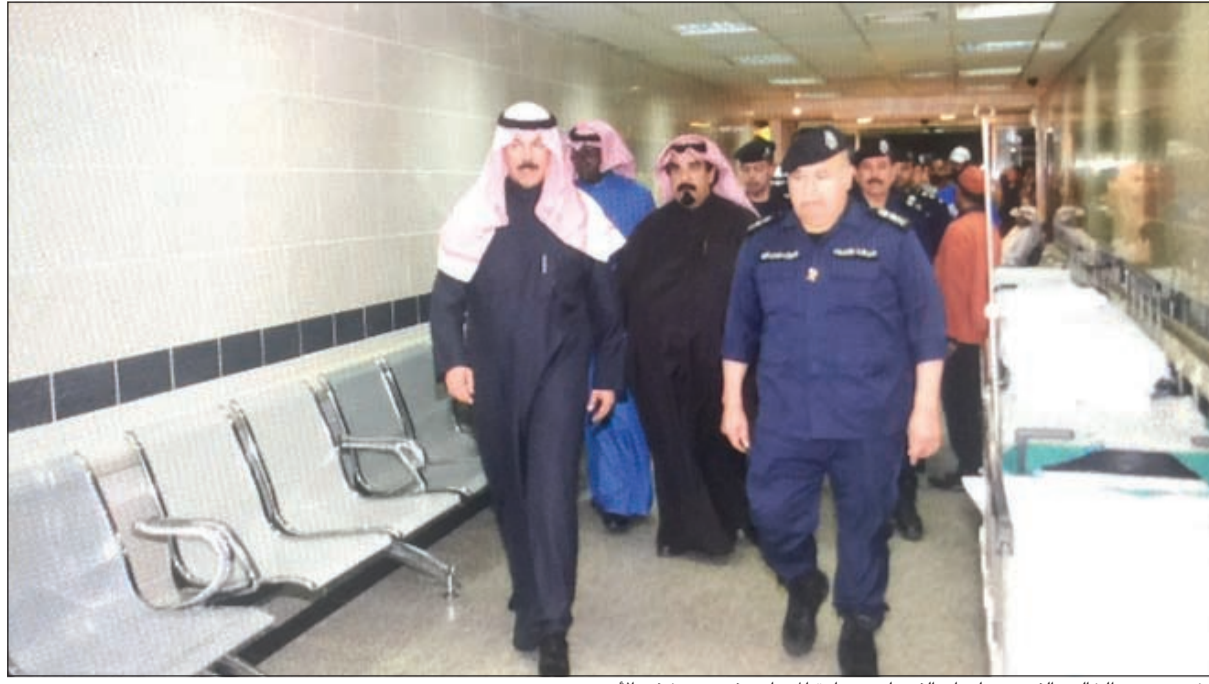
الشيخ محمد الخالد والغريق سليمان الفهد لدى زيارة المصابين في مستشفى الاميري