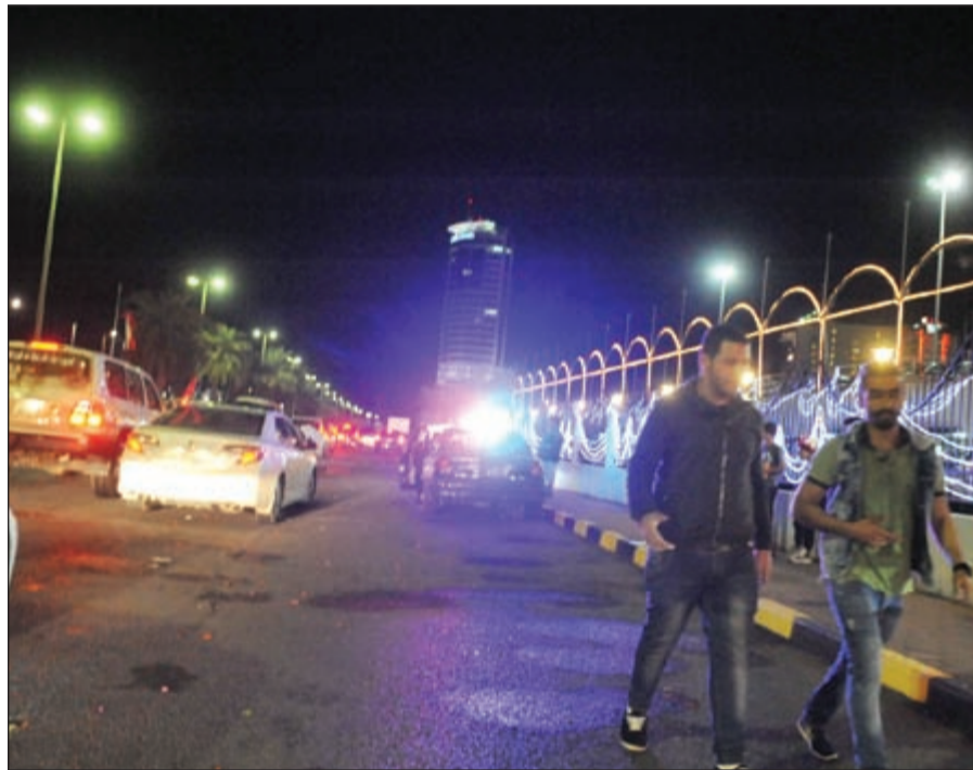
تواجد أممي كثيف أمام مستشفى الأميري بعد وصول المصابين إليه