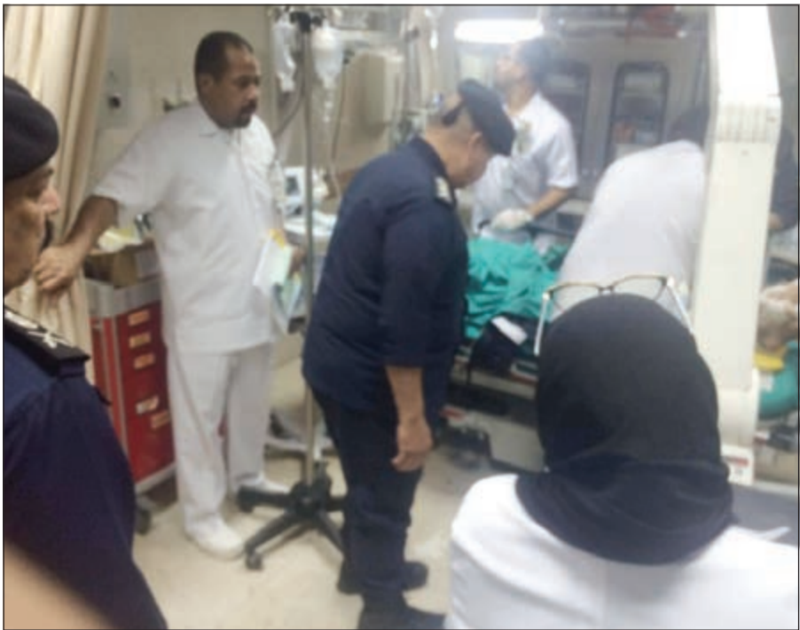
الفريق سليمان الفهد متفقد حالة أحد المصابين في المستشفى