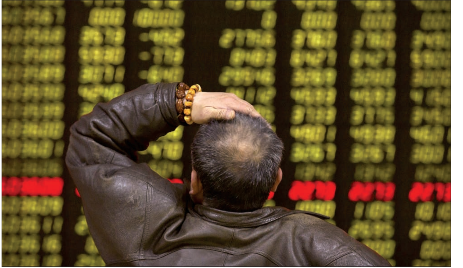
مستثمر يتطلع لوحة الكترونية تعرض مؤشرات الأسهم في شركة سمسرة بالصين حيث انهارت الأسعار بنسبة 76 أمس