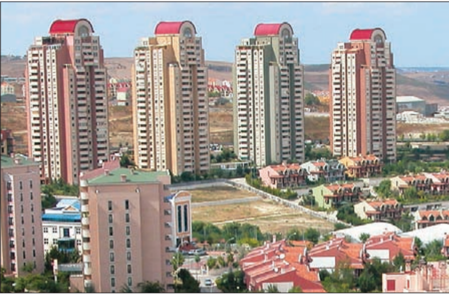
ارتفاع مبيعات العقارات في تركيا للأجانب خلال يناير الماضي

المدن التركية بيعة للعقارات للأجانب في يناير الماضي إذ بلغ عدد العقارات المباعة 498 عقارا تلتها (إيطاليا) بعدد 315 عقارا ثم (بورصا) و(يالوا) شمال غربي تركيا بإجمالي 129 و84 عقارا على التوالي. وأشارت إلى أن المبيعات انخفضت بشكل عام خلال يناير الماضي بنسبة 1,9٪ مقارنة مع الشهر ذاته في العام الماضي موضحة أن عدد العقارات المباعة في يناير بلغ 84 ألف عقار في جميع أنحاء تركيا. كما جاءت مدينة إسطنبول بالمرتبة الأولى بين المدن التركية الأكثر بيعة للعقارات بشكل عام في يناير الماضي حيث تم بيع أكثر من 15 ألف عقار فيها ثم جاءت العاصمة انقره بإجمالي عدد 9012 عقارا تلتها (إزمير) و(إيجه) بـ 5243 عقارا.