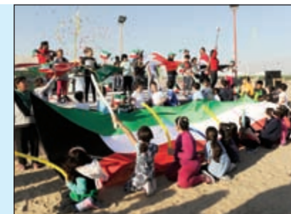
لوحة وطنية يعلم الكويت يجسدها الأطفال في مخيمات البر

رواد البر يحتفلون بالأعياد الوطنية في مخيمات الربيع تتزامن ذكرى الأعياد الوطنية في فبراير كل عام مع اعتدال الطقس ودخول فصل الربيع، فيتوجه الكثيرون من المواطنين إلى البر وتزدحم المخيمات الربيعية لتشكل مناسبة للاحتفال بهذه الأعياد في جو من البهجة والسعادة.