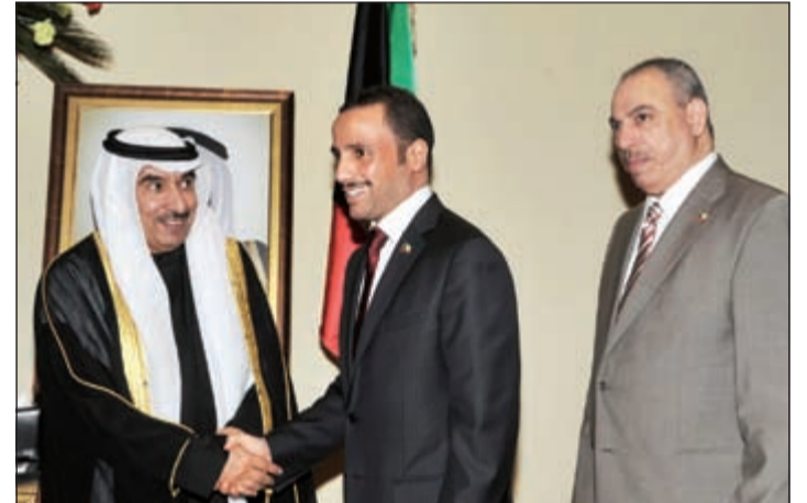
الرئيس مرزوق الغانم يتبادل التهانئ مع السفير سالم الزمانان

بين البلدين الشقيقين. وأكد عاطف أن الغزو العراقي للكويت أحدث شرخا في العلاقات العربية - العربية البيئية، لافتا إلى أن ما فعله صدام حسين انتهاك المحرمات وكان الشرخ الأول في جدار العلاقات العربية العربية. وأوضح أن المجتمع الدولي تكاتف من أجل عودة الشرعية واستعادة الكويت لحريتها، مغربا عن تمنياته بدوام الأمن والأمان والاستقرار للكويت المستقلة ذات سيادتها على أرضها وأن يسعد شعبها بثرواته ومقدراته تحت سيطرته دون تدخل أي طرف للثليل من تلك السيادة وهذا الاستقلال. وحول حجم التبادل التجاري بين البلدين، أشار السفير المصري إلى أنها في تمام ومع ضم المنتجات البترولية يصل حجم التبادل إلى نحو 3 مليارات دولار سنويا إضافة إلى الاستثمارات الكويتية في مصر التي تصل طبقا للإحصاءات الكويتية لنحو 15 مليار دولار. ولفت إلى الشركات المصرية العاملة في الكويت والتي تصل استثماراتها إلى مليار دولار وكذا تزايد السياحة الكويتية إلى مصر، مثنيا هذا الدور الذي يدعم قطاع السياحة في مصر والذي يستوعب واحدا من سبعة مصريين من حيث العمالة.