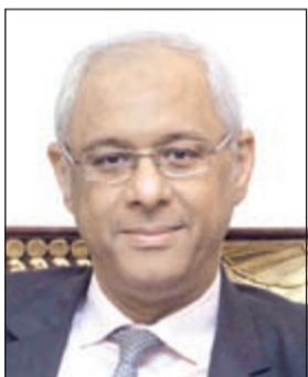
السفير ياسر عاطف