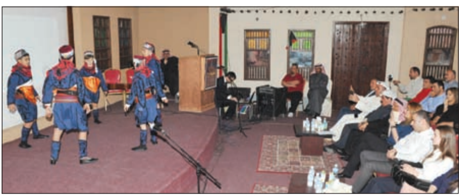
جانب من عروض الفلكلور التركي قدمه طلاب المدرسة التركية (ريليش كوماز)

ومساهماتها في تحرير الكويت، مؤكدا أن الكويتيين لن ينسوا أبدا كل من مد يد المساعدة وشارك في حرب تحرير الكويت وعودة الشرعية لها، كما شكر المدرسة التركية في الكويت على مشاركتهم في هذا الحفل من خلال فقرات فنية مميزة من طلاب المدرسة. من جانبه أثنى مدير المدرسة التركية بالكويت على العلاقات الأخوية المتينة التي تربط الكويت وجمهورية تركيا، معبرا عن سعاده بالمشاركة في احتفالات الكويت بأعيادها الوطنية. بعد ذلك قدم طلاب المدرسة التركية عروضاً فنية من الفولكلور التركي الجميل.