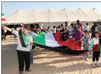
علم الكويت بأيدي أطفالها في مخيمات البر