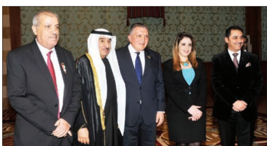
السفير سالم الزمانان والمستشار د. فريح العنزوي ومدير عام فندق سفير الدقي

عزيزة ليس فقط لأبناء الشعب الكويتي وإنما لكل أبناء الشعب العربي. وأعرب الغانم عن سعادته بالمشاركة المصرية الكبيرة من وزراء ومسؤولين ونواب وأبناء الشعب الذين جاؤوا لتقديم