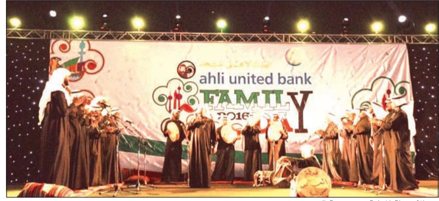
من الأنشطة القائمة في حديقة الشهيد

في إطار برنامجه للاحتفال بالأعياد الوطنية، أقام البنك الأهلي المتحد يوما مفتوحا لموظفي البنك وعائلاتهم في حديقة الشهيد يوم السبت الماضي، تضمن العديد من المفاجآت والفقرات الترفيهية وتوزيع الجوائز.