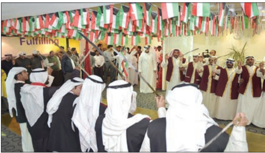
من احتفالات VIVA بالأعياد الوطنية

والتبريكات، سائلين المولى عز وجل أن يمن على الكويت بالأمن والخير والسلام.