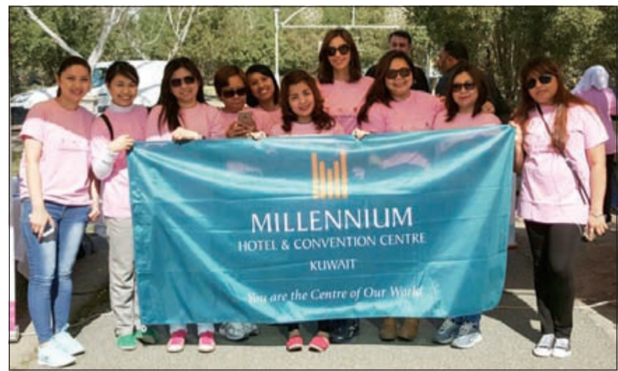
فريق ميلينيوم المشارك بالماراثون

وخلال المعرض، عرضت العديد من المنتجات للعديد من شركات الضيافة والأغذية والمشروبات، وشارك أكثر من 100 طاه تنافسوا ضمن 16 فئة مختلفة بإشراف لجنة من المتخصصين، وخلال الحدث الذي استمر 3 أيام، أعيد عرض دولي لفن الطبخ، إضافة إلى سلسلة من مسابقات العروض الحية، وذلك لإظهار المهارات العالمية التي يتمتع بها الطهاة من مختلف الفنادق والجهات المشاركة. وشارك فريق من الطهاة المحترفين من فندق جي دبليو ماريوت الكويت وفندق كورت