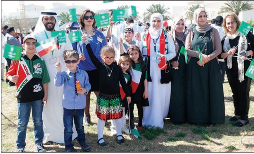
جانب من احتفالات مركز الكويت لمكافحة السرطان برعاية «التجاري»

الدائم مع المركز ومشاركته في المناسبات والفعاليات المجتمعية التي تهتم بالمرضى، إيمانا بمسؤوليته الاجتماعية التي تقع على عاتق القطاع الخاص تجاه مؤسسات المجتمع المدني.