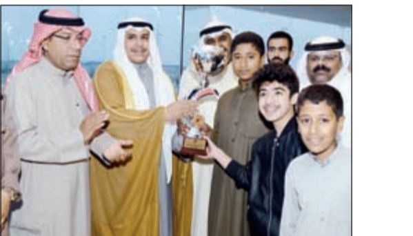
الشيخ خالد فهد السعود يسلم كأس عبدالله السالم للفتان

خرج اسطيل النشاما متصدر دوري النقاط من موسم سباقات الصيد والفروسية «من المولد بلا حمص»، بالرغم من الترشحات التي كانت تصب في كفته، في الشوط السادس المخصص لجميع الدرجات على مسافة 2200م، للفوز بكأس المغفور له الشيخ عبدالله السالم، إلا ان الجواد، عشق لاسطيل جليل بقيادة لويس استغل الصراع بين جواد النشاما وجواد العيصي واقتنص الكأس الغالية، وقام الشيخ خالد فهد السعود بتقديم الكأس الى اسطيل الجليل. ونجح الجواد جزام لثاني الرشدي بقيادة ابديل في الفوز بالكأس المقدمة من ورثة المغفور له الشيخ محمد الأحمد الجابر والمخصصة لجواد الدرجة الثالثة. وفي بقية المهرجان فاز الجواد حاييس بجائزة المكرمة الأميرية للنتاج المحلي وفاز الجواد المايسترو بكأس التحرير المخصصة للمبتدئات.