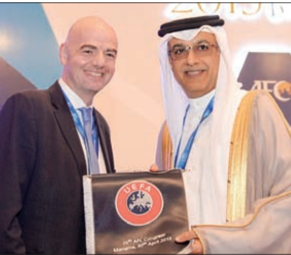
الشيخ سلمان بن إبراهيم وجياني إنفانتينو في انتخابات الاتحاد الآسيوي بالمنامة في أبريل الماضي

اما الورقة الثانية التي سيلعبها الأمير الأردني الشاب، فهي عرقلة وصول الشيخ سلمان من خلال أخذ أصوات كانت تصب في خاتمة رئيس الاتحاد الآسيوي، مع معرفته