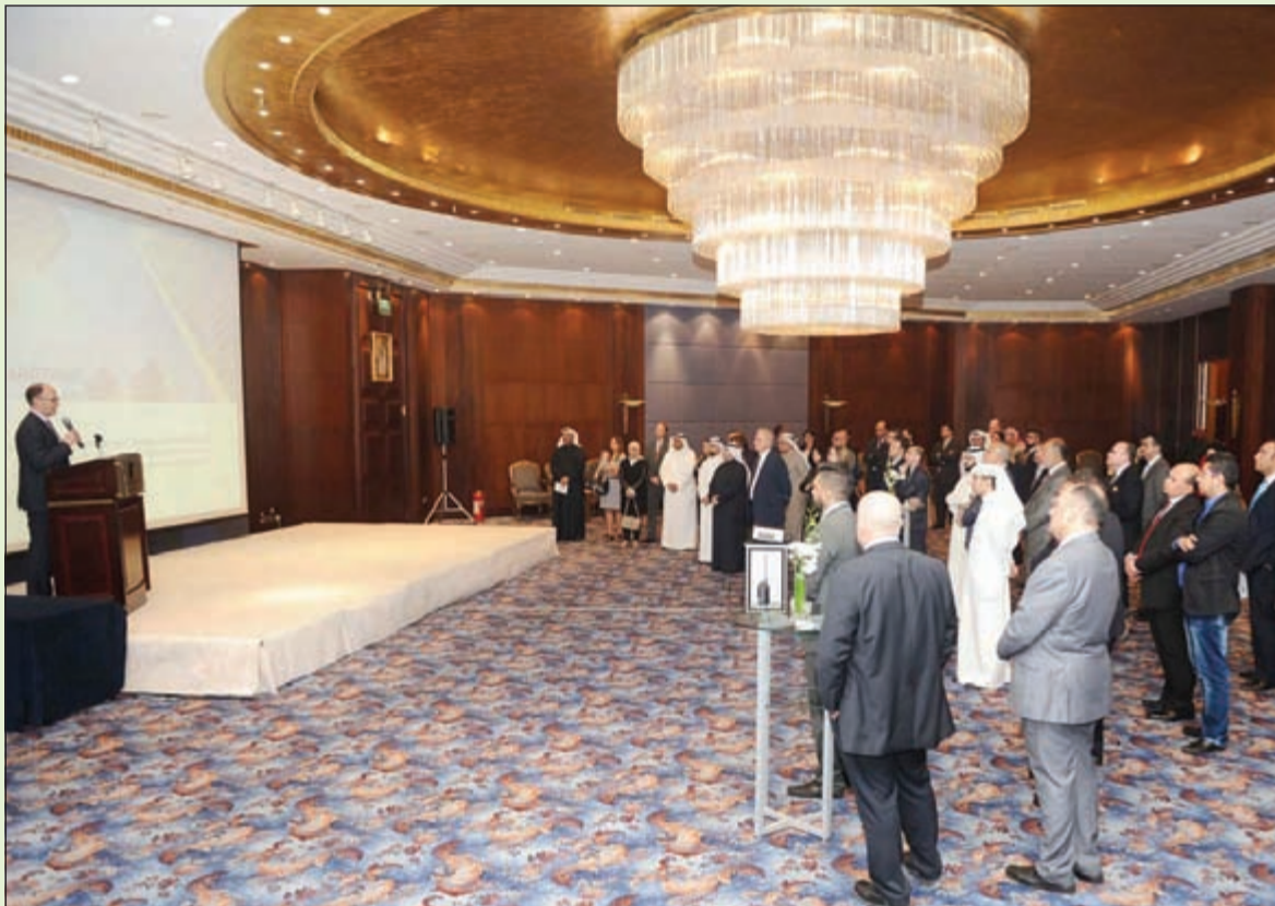
السير الأميركي ملغيا كلمته خلال الحفل

مشروعات قائمة حالياً مع شركاء كويتيين خارج الكويت