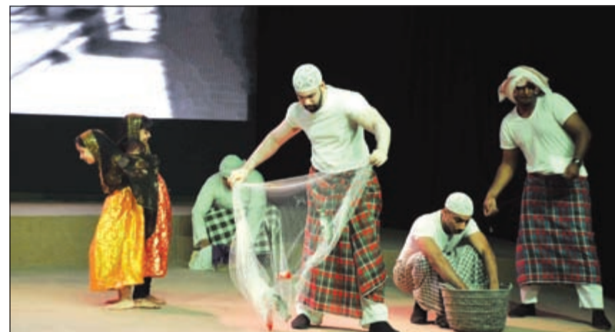
أحدى الفقرات الفنية خلال الحفل