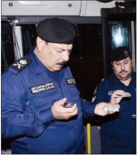
.. واللواء عبدالفتاح العلي يفحص أوراق أحد الوافدين