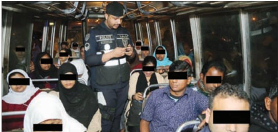
فحص إثباتات وافدين في باص

وأغلقت أجهزة الأمن المشاركة في الحملة محط خيطان منذ الخامسة فجرا ولمدة ساعتين في إطار خطة تناولت كافة محاور وأليات العمليات الميدانية والاستعداد المكثف وتوفير الدعم والإسناد اللازم لها، ووجه الفريق الفهد عناصر القوة إلى الانتشار في شوارع وطرق المنطقة لملاحقة وضبط كل المطلوبين على ذمة قضايا والمخالفين للقوانين المشتبه بهم وبعد اتخاذ الإجراءات القانونية اللازم تمت مداومة بعض الأماكن المشبوهة للتدقيق على ساكنيها أو مرادياتها بغية التأكد من وضعهم