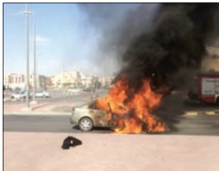
مركبة احترقت مقدمتها بالكامل