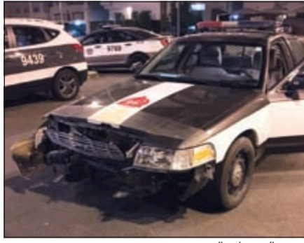
إحدى الدوريات التي تضررت