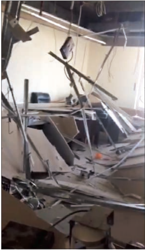
السقف الذي سقط على مكاتب الموظفين

سقط قبل الدوام فنجا الموظفون من التعرض لمصيبة كبرى