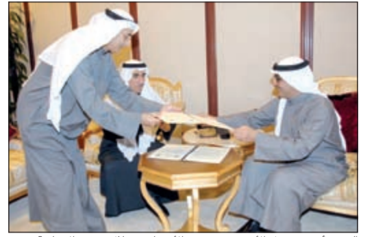
الشيخ أحمد مشعل الأحمد وديحسين الانتصاري خلال توقيع الاتفاقية

وَقَّع جهاز متابعة الأداء الحكومي مذكرة تفاهم مع جامعة الكويت بهدف الاستفادة من الخبرات الاستشارية التي تتمتع بها الجامعة من خلال الأكاديميين والمتخصصين في الكليات والمراكز التابعة للجامعة.