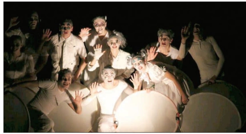
مشهد من مسرحية «حديقة دائرة الأحلام»

لم تكن الليلة الأخيرة في المسابقة الرسمية للمهرجان الأكاديمي السادس، الذي تحتضنه الكويت في الفترة من 14 إلى 20 الجاري، عادية، خصوصا أنها كانت ليلة عرض «حديقة دائرة الأحلام» لفرقة أكاديمية المسرح بروما - إيطاليا، حيث كان الجمهور في انتظار العرض بعد النجاح الساحق الذي حققته الفرقة في الدورة الخامسة للمهرجان وحصولها على جائزة أفضل عرض متكامل عن مسرحية «في عقلي».