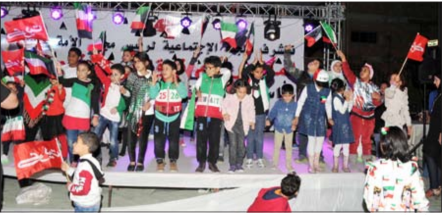
من اليوم المفتوح