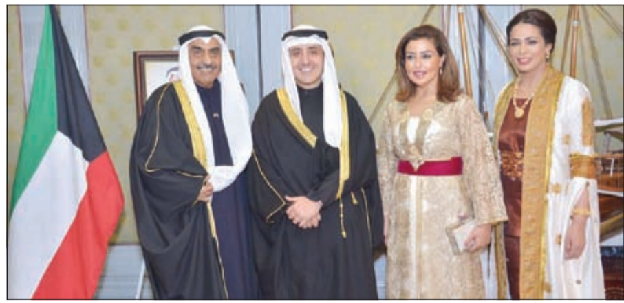
السفير الشيخ د. أحمد ناصر المحمد وجرمه مع السفير فهد العوضي وجرمه

قربنا - نيودلهي - كونا: أقام سفيرنا لدى الهند فهد أحمد العوضي حفل استقبال بمناسبة العيد الوطني الـ 55 لاستقلال الكويت والذكرى الـ 25 لتحريرها بحضور عدد من كبار المسؤولين وأعضاء البعثات العربية والأجنبية في نيودلهي.