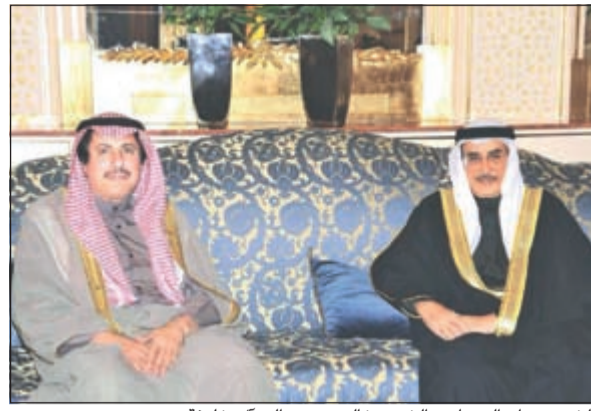
الشيخ عزام الصباح والشيخ خالد بن عبدالله آل خليفة

رابع الوطن. وقال الشمالي لـ «كونا» على هامش الحفل الذي أقيم مساء أمس الأول أن احتفالات الكويت بأعيادها الوطنية فرصة نستذكر من خلالها أروع مشاهد التلاحم والتضافر التي شهدتها الشعب الكويتي في أصعب الظروف وأشد المحن التي مرت بها البلاد. وأكد أن الشعب الكويتي أثبت خلال تلك الفترات العصبية للعالم اجمع أنه شعب يقف يداً واحدة خلف قيادته السياسية الحكيمة في السراء والضراء مما كان له بالغ الأثر في إبراز الوجه الحضاري للكويت وفرض احترام وتقدير المجتمع الدولي لوطننا. من جانب آخر، أشاد الشمالي بمستوى العلاقات بين الكويت وسلوفاكيا، واصفاً إياها بالمتينة. وقال أن العلاقات الثنائية شهدت تطوراً ملحوظاً في مختلف المجالات لاسيما الاقتصادية وذلك انطلاقاً من الحرص المشترك على الارتقاء بها إلى مستوى العلاقات السياسية. من جهتهم، هنأ رؤساء البعثات الدبلوماسية المعتمدة لدى سلوفاكيا الكويت بأعيادها الوطنية متمنين لها دوام التقدم والازدهار.