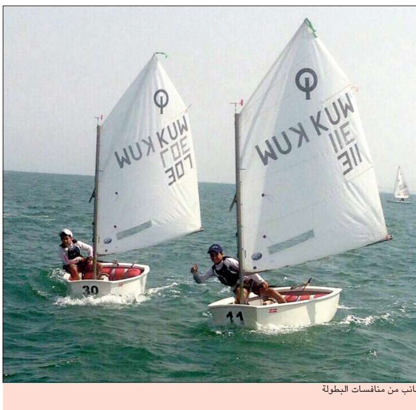
جانب من منافسات البطولة

تختتم على مجمع ميادين الشيخ صباح الأحمد الأولمبي للرمية في تمام الساعة 5:00 مساء كاس شركة ناقلات النفط الكويتية وتوزيع الكؤوس والميداليات والجوائز على الرماة والراميات الحاصلين على المراكز الثلاثة الأولى بالمسابقات وهي الكأس