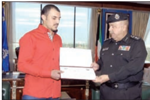
الفريق سليمان الفهد مكرما الوافد المصري

وحرص على استتباب الأمن، مضيفا أن تطبيق القانون واجب رجال الأمن الذي لا يتوانون في أدائه بكل قوة وبمسالة، وأشاد بشجاعة وتصدي المكرمين لهؤلاء الخارجين عن القانون الذين حاولوا أن يعكسوا صفو أمن المواطنين والمقيمين في منطقتة الفروانية، قائلا إن تصرفهم السريع تجاه هذا الحدث يتم عن حسهم الأمني العالي في فرض هيبة القانون.