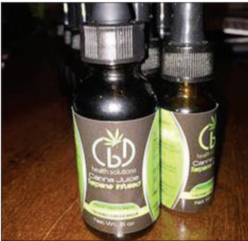
عبوات متنوعة بنكهات «السجائر والماريغوانا»

قبل ما فيها هدفها توسيع قاعدة التعاطي، قال المصدر: لا استطاع الجرم بذلك ولكن هناك بلدانا وحتى احتواء بعضها على الحشيش والماريغوانا، وردا على سؤال عما اذا كانت هذه النكهات المخلوطة بالحشيش والماريغوانا تصنع من محددات للمخدرات.