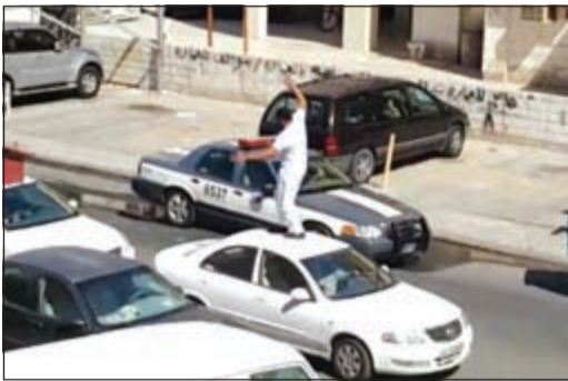
اللغعات المصورة التي لاقت استهجانا شديدا

وامتدح الفريق الفهد ردة فعل المواطنين والقانونيين، وقال: إننا لمسنا مشاعرهم الراضية لهذا الاعتداء المشين على رجل الأمن، ومؤكدين وقوفهم مع رجال الأمن في تطبيق القانون، ووجه الفريق للفهد الشكر والتثناء للمواطنين والمقيمين في اللقاء مع رجال الأمن في إنفاذ القبض على المعتدين وإحساسهما بالمسؤولية المجتمعية وحرصهما على هيبة القانون.