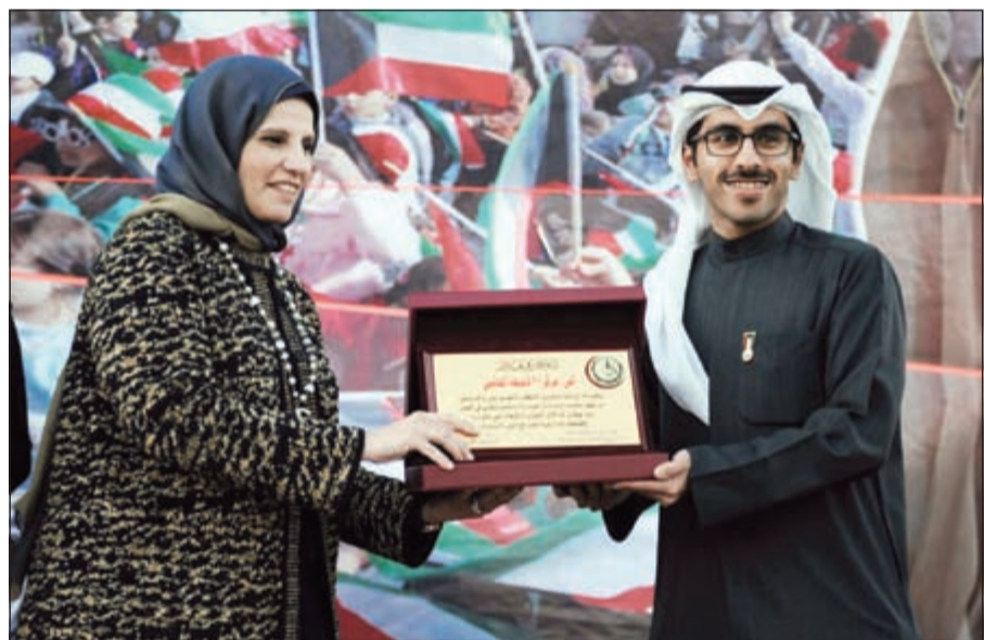
لجنة رئيس مجلس الأمة تكرم «بيتك»

معرض توعوي وإرشادي لفئة ذوي الإعاقة وفقرات ترفيهية واجتماعية ومسابقات وجوائز.