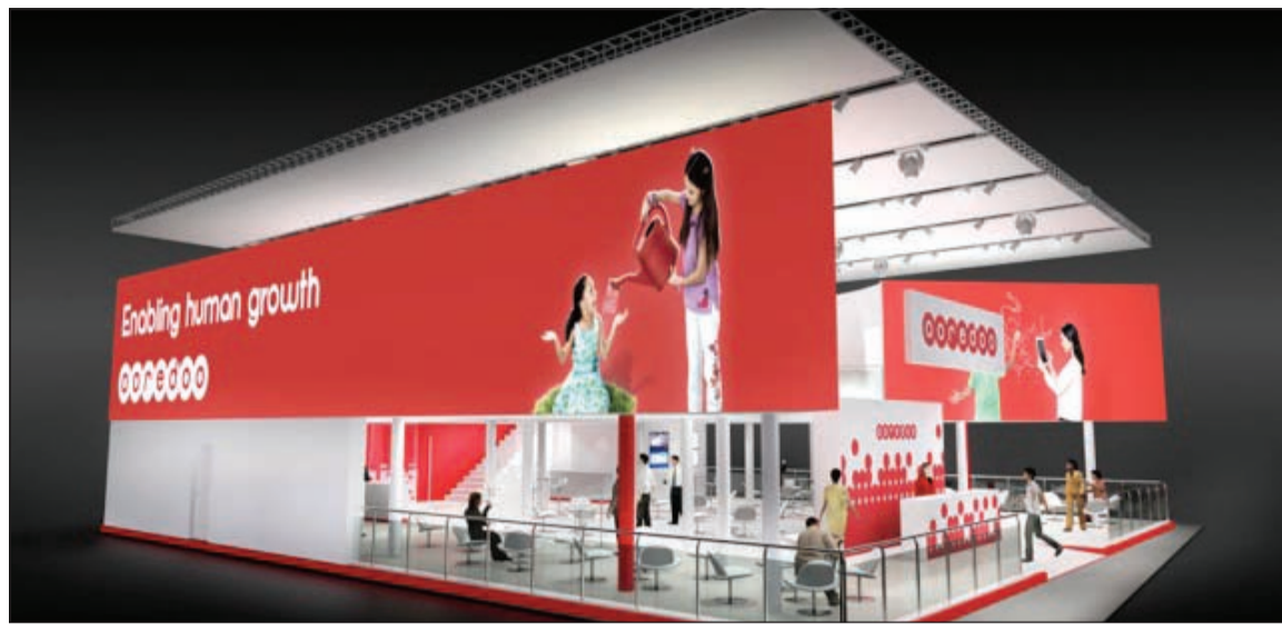
جناح Ooredoo في المؤتمر

تستعرض مجموعة Ooredoo العالمية للاتصالات باقة من الحلول والخدمات المتطورة خلال المؤتمر العالمي للجوال الذي سيقام في برشلونة بإسبانيا الأسبوع المقبل.