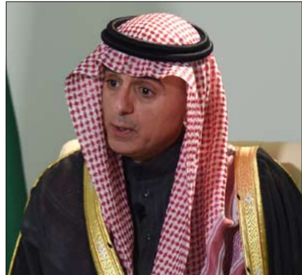
وزير الخارجية السعودي عادل الجبير في مقابلة خاصة مع وكالة فرانس برس أمس بالرياض

وعن الملف اليمني، أكد الجبير ان المملكة ستحافظ على حصتها من سوق النفط