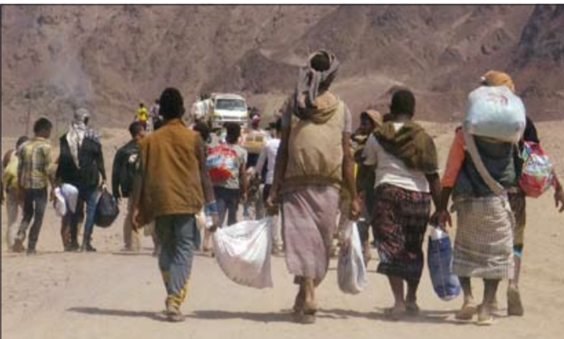
يمنيون نازحون من عدن عقب التفجير الانتحاري الذي استهدف معسكر «راس عباس» أمس الأول

والمقاومة بإسناد مباشر ومكثف من طيران التحالف العربي، تقدما كبيرا باتجاه نقيز بن غيلان وسد عامر والحمران شرق العاصمة صنعاء، وذلك بعد وصول تعزيزات عسكرية كبيرة ومزودة بأسلحة متطورة في إطار التحضيرات لمعركة استكمال تحرير الشقوق الأمني لصنعاء بالكامل. وقالت مصادر ميدانية في المقاومة لـ «الأنباء»: ان مواجهات عنيفة وقعت في منطقة يران بمسورة بين قوات الجيش الوطني والمقاومة من جهة وميليشيات الحوثي وصالح من جهة أخرى، وذلك بالتزامن مع قصف عنيف بالصواريخ والمدفعية على مواقع المتطرفين في منطقة نقيز بن غيلان الاستراتيجي. وأكدت المصادر توغل الجيش مسنودا بالمقاومة نحو مواقع مهمات ميليشيات الحوثي وصالح بعد مديرية نهم، باتجاه نقيز بن غيلان الذي يعد آخر حزام أمني قوي للميليشيات حول صنعاء. كما أحرزت المقاومة والجيش الوطني تقدما نوعيا جديدا باتجاه مركز مديرية صرواح غرب محافظة مأرب، بحسب ما أفادت مصادر عسكرية «الأنباء».