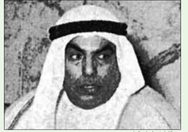
عبد اللطيف ثنيان الغانم

ولد عام 1912 في حي القبلة بمدينة الكويت القديمة، وتوفي عام 1988، درس منذ طفولته في المدرسة المباركية ثم في المدرسة الاحمدية، وسافر في عام 1922 إلى الهند بصحبة والده الذي كان يدير تجارة كبيرة هناك. وفي الهند اعتمد عليه والده وهو في بداية شبابه في تصريف بعض الأعمال، وكان يتردد على أماكن متعددة بين الكويت والبصرة والهند، مما أعطاه فرصة لمخالطة الشخصيات الكويتية والعربية والأجنبية التي أسهمت في بناء شخصيته التي لعبت دوراً بارزاً في وضع اللبنيات الأولى للديموقراطية بالكويت. وعندما عاد إلى البلاد شارك هو ورفاقه عام 1938 في أول حركة دستورية أنبثق عنها ما سمي بالمجلس التشريعي الأول الذي وافق على إنشائه الأمير الراحل الشيخ أحمد الجابر الصباح، رحمه الله، ثم انتخب عضواً في ذلك المجلس الذي كان يتألف من أربعة عشر عضواً. ثم انتخب عضواً في المجلس البلدي عام 1954 ورشح مديراً له، وفي عام 1962 استقال من رئاسة المجلس البلدي ليرشح نفسه في مجلس الأمة التأسيسي عام 1962 عن دائرته في منطقة كيفان، وفاز بالعضوية، وتم انتخابه بالإجماع لرئاسة المجلس الذي كان من مهامه وضع دستور دولة الكويت المستقلة عام 1961. وفي عام 1963 تولى وزارة الصحة العامة، ثم وزيراً للأشغال العامة، ثم تفرغ لأعماله الخاصة.