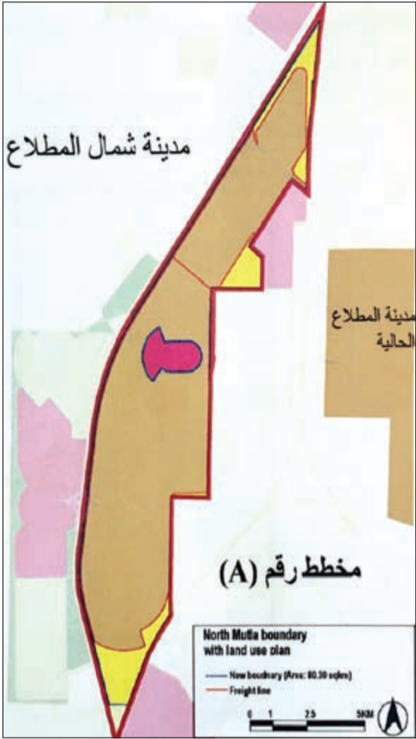
خريطة توضح التوسعة الجديدة في المدينة

تعارضه مع أي خدمات للوزارات المختلفة حالياً أو مستقبلياً.