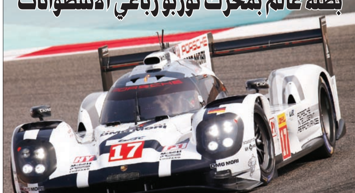
بورشه 919 هايبريد

كشفت بورشه النقاب عن التفاصيل المرئية لمحرك سيارتها «919 هايبريد» الفائزة بسباق «لومان». ويسيط نجم هذا المحرك المدمج للغاية، الذي تبلغ سعته لبترين فحسب، بكونه أكثر محرك احتراق داخلي فاعلية صنعته بورشه حتى الآن. وقد شكل القاعدة الرئيسية للانتقال التكنولوجي إلى محرك الأربع أسطوانات توربو الجديد المعتمد في بورشه «718 بوكستر». في هذا السباق، وظفت بورشه الخبرة والمعرفة اللتين اكتسبتهما في رياضة السيارات في ثلاثة مجالات، تشمل الحيز بين الأسطوانات والشوط القصير و«حقن الوقود المباشر» الوسطي. وقال الكسندر هيتزنجر، المسؤول التقني عن 919: «اعتدنا مفهوما شجاعا ولكن صحيحا منذ البداية. والآن تؤتي هذه الفارقة ثمارها».