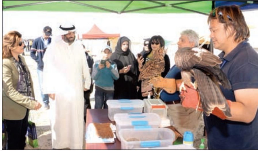
مشاركة من المركز العلمي

وأشارت إلى أنها تعد الأولى من نوعها في الكويت من حيث توجيهها إلى طالبات التعليم العام (المدارس الحكومية) للمرحلتين المتوسطة والثانوية، وتسعى إلى تنمية الولاء الوطني من خلال دعم مشاريع وابتكارات بناءة وتشجيع الفتيات على التميز العلمي التخصصي ودعم المشاريع المميزة والمساعدة على ابتكار مشاريع ذات مردود علمي وعطاء مؤثر في تطوير الحركة العلمية.