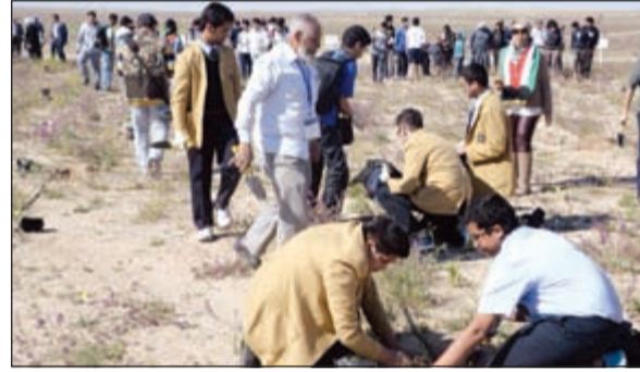
جانب من المشاركين

وأضافت ان الورشة العلمية تتعلق بوحدة من المناطق البيئية الهامة التي تشغل مساحة تعادل 1,11٪ من مساحة الكويت، ونتيجة لغياب التشريعات المنظمة للصيد والرعي الجائر والأنشطة العسكرية، تعرضت المنطقة الى القضاء الكامل على الحياة الفطرية وفقدان التنوع البيولوجي فيها، لذا توجهت