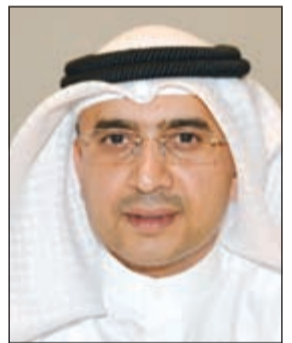
د. هيثم الأثري

دعا وكيل وزارة التربية د. هيثم الأثري ديوان الخدمة المدنية إلى الموافقة على قيام الوزارة مباشرة باتخاذ الإجراءات القانونية اللازمة لشغل الوظائف الإشرافية التي تشغر بسبب ترقية شاغليها الأصليين وتوليهم وظائف إشرافية أعلى، دون الانتظار لمدة ستة كاملة. وقال الأثري في كتاب وجهه لرئيس ديوان الخدمة المدنية، حصلت «الأنباء» على نسخة منه، إن الفقرة الأولى من المادة 3 من قرار مجلس الخدمة المدنية رقم 2006/25 تنص على أن يكون