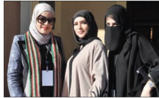
مجموعة من المشاركات في المركز الإقليمي للأمومة والطفولة