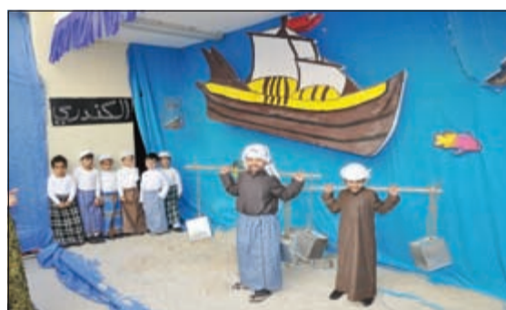
«الكندري»، كان حاضراً في فعاليات المهرجان