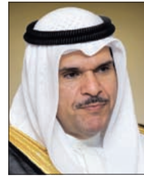
الشيخ سلمان الحمود

الكويت سجلت تقدماً كبيراً في رفع مستوى الثقافة الشبابية وتحقيق الشراكة المجتمعية