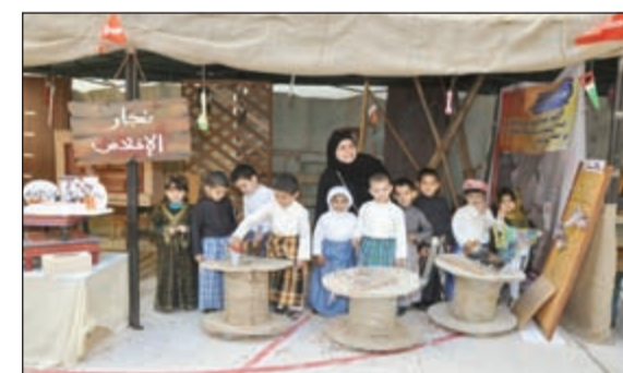
النجارة من الحرف الكويتية القديمة التي جسدها أطفال مدرسة الرسالة