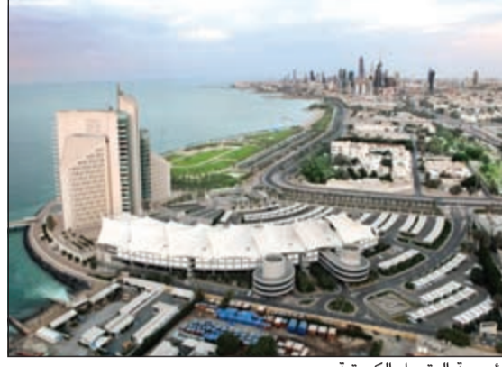
مؤسسة البترول الكويتية

اعلى مستوياتها في ميزانية 2013/2012 عند 35,9 مليار دينار لتكشف حجم أزمة انخفاض النفط. وفي المقابل بلغ إجمالي المصروفات المقدرة في السنة المالية المقبلة 9,5 مليارات دينار، بتراجع نحو 5,7 مليارات دينار أو نحو 37٪، وذلك بعد إلغاء الصرف على مبالغ مكافئة مشاركة النجاح وحفلات وهدايا قدامى العاملين وتكلفة المخيمات الربيعية والأندية والمعاهد الصحية وجميع الأنشطة الاجتماعية والثقافية والمصروفات الأخرى وعلى هذا الأساس ستقدر الأرباح الصافية للسنة المالية المقبلة بنحو 236,2 مليون دينار.