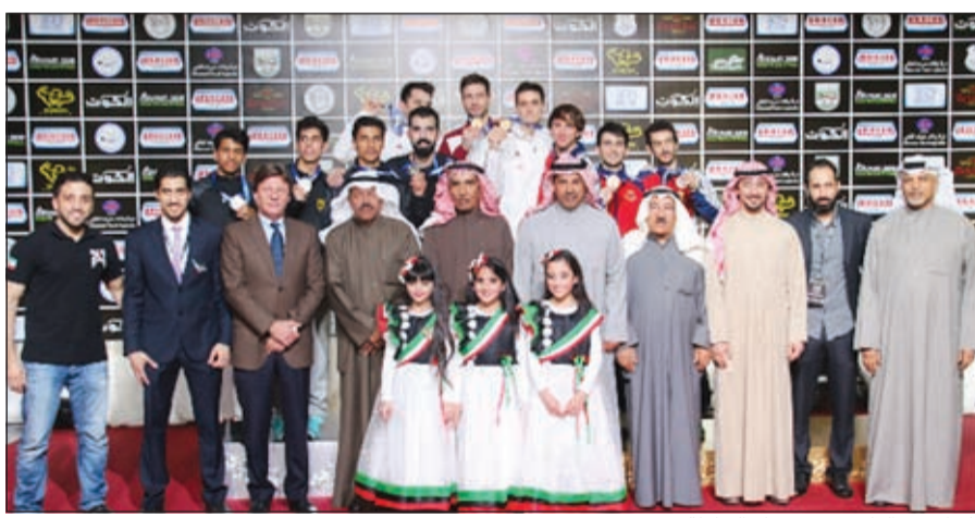
فليطح مع الفائزين في ختام البطولة

أنها حققت العديد من الأهداف أهمها قدرة الشباب الرياضي على تنظيم حدث كبير وكذلك إقامة نوع جديد من المسابقات وهي مشاركة الفرق بجميع الأسلحة الثلاثة (فلوريه، السابر، الإيبه)، الأمر الذي قد يؤدي إلى إقامتها مستقبلاً في البطولات العالمية خاصة أنها تحقق مزيداً من روح المنافسة والإثارة والندية في اللعبة.