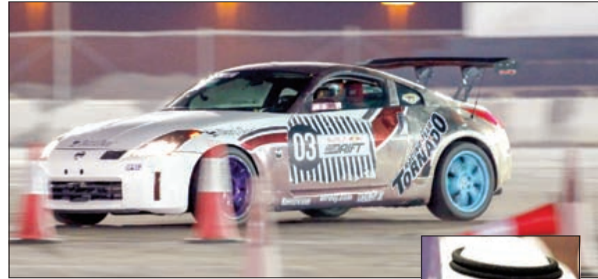
من البطولة السابقة