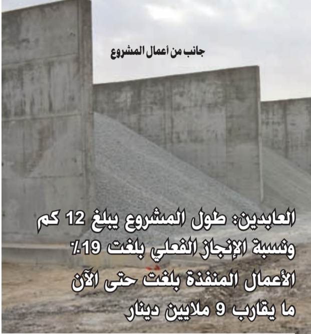
جانب من أعمال المشروع

العابدين: طول المشروع يبلغ 12 كم ونسبة الإنجاز الفعلي بلغت 19% الأعمال المنفذة بلغت حتى الآن ما يقارب 9 ملايين دينار