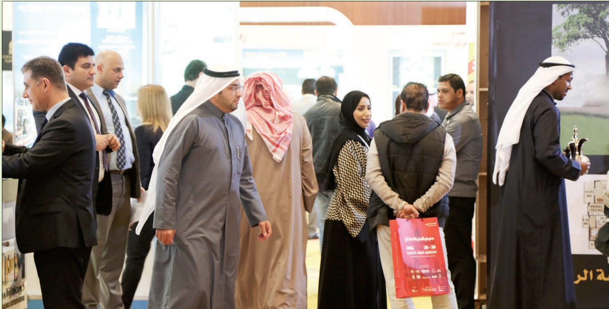
إقبال جماهيري كبير على معارض إسكان جلوبل العقاري