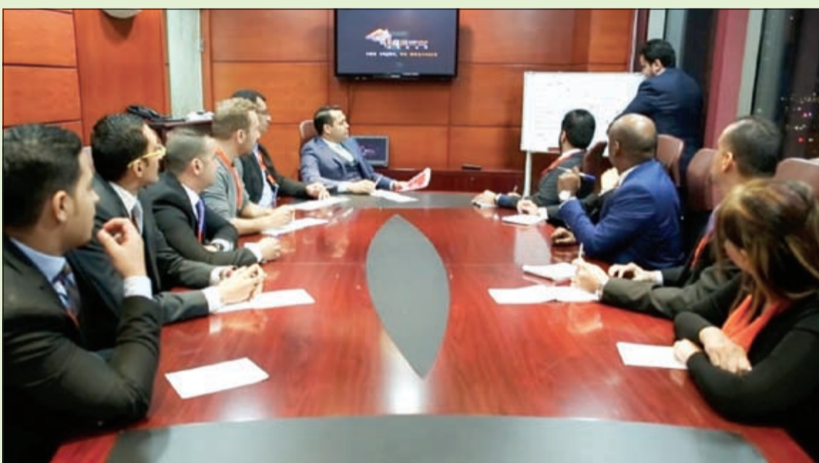
جانب من استعدادات إسكان جلوبل

وقال النبوس: إن «إسكان جلوبل» وباعتبارها واحدة من الشركات الرئيسية العاملة في مجال تنظيم المعارض والمؤتمرات العقارية