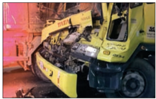
سيارة التنظيف وقد تهشمت مقدمتها

عند وصول رجال الإطفاء تبين أن الحادث كان قويا جدا وقام رجال الإطفاء بالتعامل مع الحادث بحرفية عالية وتبين أن هناك شابين كويتيين الجنسية محشورين بالداخل إثر الصدمة القوية التي تعرضا لها