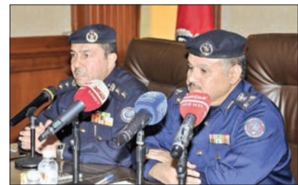
العميد جمال البليهيص والعميد خليل الأمير خلال المؤتمر الصحافي