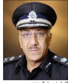
اللواء فيصل السنين

قال وكيل وزارة الداخلية المساعد لشؤون أمن المنافذ بالإنابة اللواء فيصل السنين إن مطار الكويت قدم من خلاله 513,030 ألف شخص وغادر منه 462,957 ألف شخص بإجمالي 975,987 ألف شخص خلال الفترة من 2016/1/31 إلى 2016/1/1 في 200,194 قداما، ومغادرة 190,660 للمواطنين و33,924 قداما، ومغادرة