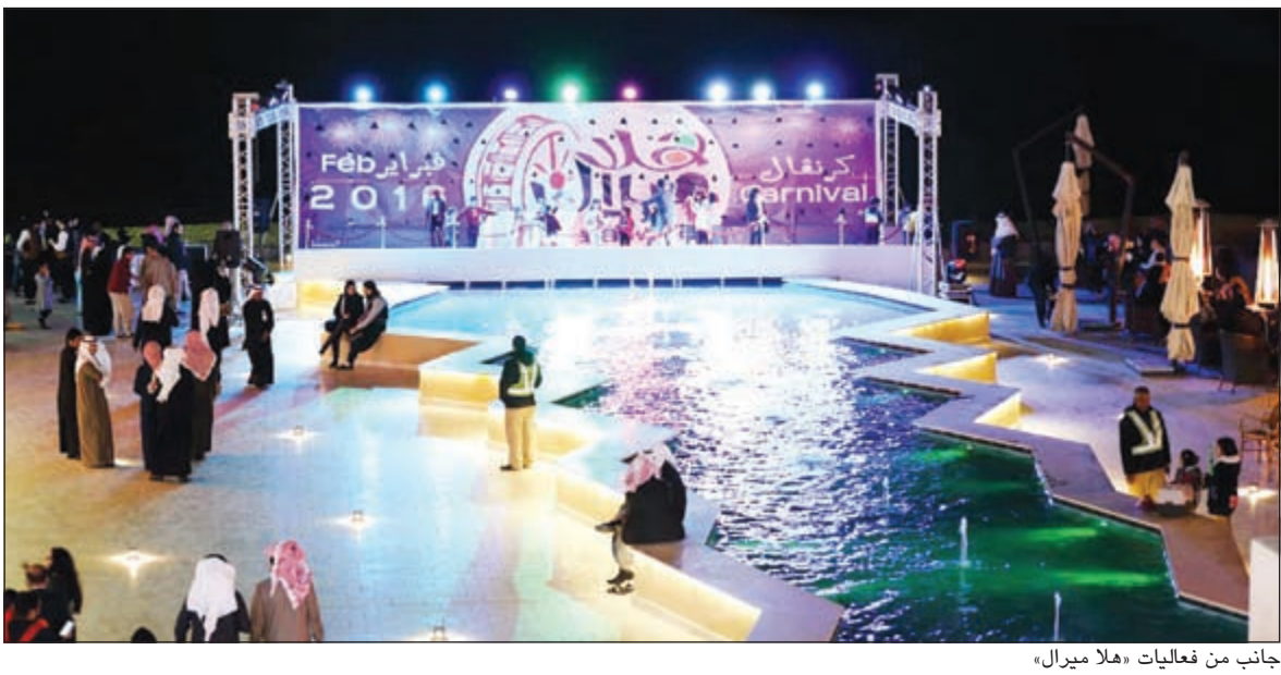
جانب من فعاليات «هلا ميرال»