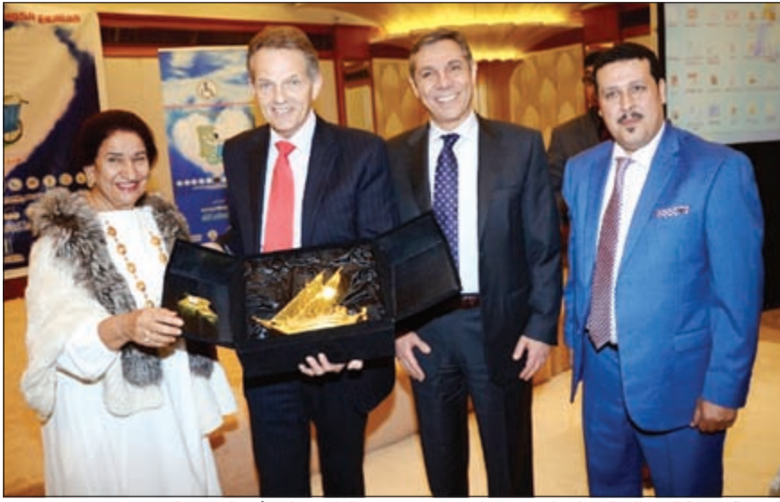
الشيخة شيخة العبد الله الصباح تكرم ريتشارد جروفز ومعتز الرافي نائب أول الرئيس التنفيذي

أعلن البنك الأهلي المتحد عن مشاركته ورعايته لـ «المشروع الكويتي لذوي الاحتياجات الخاصة» التاسع، والذي انعقد يوم 4 فبراير 2016 بفندق شيراتون الكويت، انطلاقاً من استراتيجيته المستدامة من أجل تعزيز مشاركته المجتمعية.