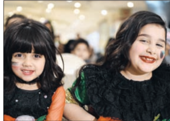
زهرة حضرنا السحب

الكبير. وأضاف أن العديد من محلات مجمع «مغاتير» في حولى تقدم خصومات وهدايا كبيرة خلال فترة المهرجان بالإضافة إلى أن عمليات الشراء من تلك المحلات ستتيح الفرصة للمشترين للحصول على كوبونات تؤهلهم للدخول في السحوبات على العديد من السيارات والجوائز القيمة.