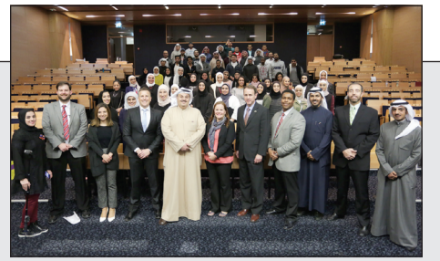
لقطة تذكارية للثلاثين على الورشة وأعضاء السفارة الأميركية في الكويت والتدريب