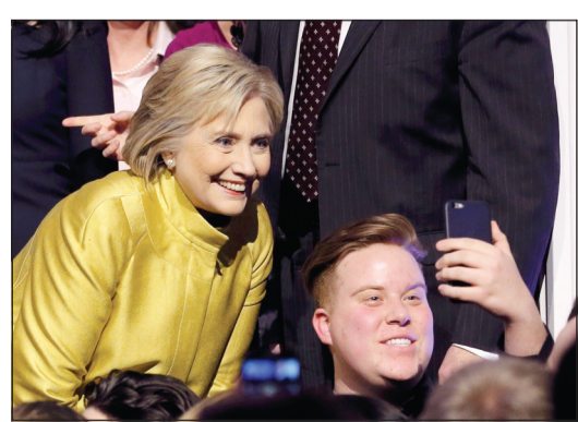
المرشحة الديموقراطية المحتملة للرئاسة الأميركية هيلاري كلينتون في «سيلي» مع أحد انصارها قبيل بدء المناظرة أمس الأول

على تجربتها على رأس الدبلوماسية الأميركية بينما انتقدتها ساندرز لتصويتها لمصلحة حرب العراق في 2003، معتبراً انه خطأ في التقدير. وقالت كلينتون في المناظرة التي بثتها قناة بي بي اس من جامعة ويسكونسن في ميلووكي «علينا ألا نقطع وعوداً لا يمكننا تحقيقها». وبعد ذلك تصاعد النقاش حول القطاع الصحي، حيث انتقدت كلينتون الكلفة الكبيرة لاقتراح ساندرز حول تأمين صحي عام وشامل. وقالت ان «كل اقتصادي اليسار الذين حللوا الاقتراح رأوا انه مكلف». واقترحت بدلا من ذلك نظاماً تدريجياً. وقالت: «لسنا فرنسا».