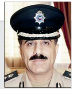
الواء ماجد الماجد