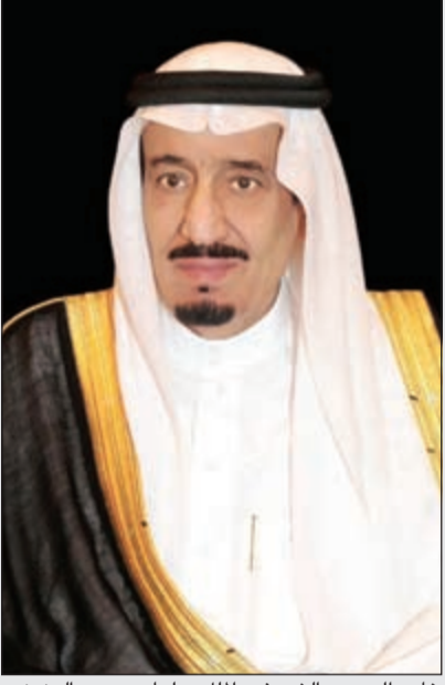
خادم الحرمين الشريفين الملك سلمان بن عبدالعزيز

القاهرة - أ.ش.أ: أعلنت السفارة السعودية بالقاهرة امس عن قيام خادم الحرمين الشريفين الملك سلمان بن عبدالعزيز آل سعود بزيارة رسمية إلى مصر في الرابع من شهر أبريل 2016. وأكد سفير خادم الحرمين الشريفين لدى جمهورية مصر العربية مندوب المملكة الدائم لدى جامعة الدول العربية السفير أحمد بن عبدالعزيز قطان أن هذه الزيارة تأتي في ظل الاهتمام الكبير الذي يوليه خادم الحرمين الشريفين بمصر حكومة وشعبا، وحرصه على تعزيز التعاون المستمر بين البلدين الشقيقين في المجالات كافة.