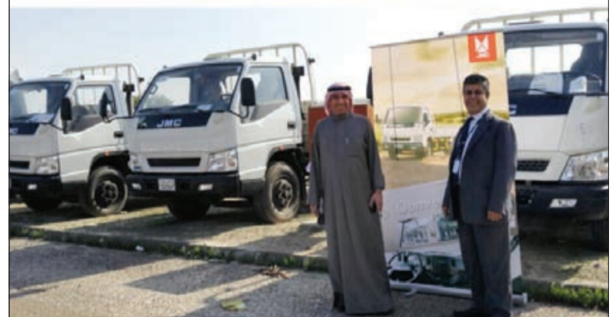
أوتوماك تسلم وزارة الكهرباء والماء شاحنات «جيه أم سي»

200 ألف كيلومتر، وذلك للمرة الأولى على فئة الشاحنات. وتتمتع شاحنات (JMC) بالفعالية وقوة التحمل، وتتمتع بمواصفات خليجية تطابق المتطلبات العصرية للأعمال التجارية والإنشائية. وتتضمن العلامة التجارية (JMC) مجموعة متنوعة من الشاحنات تبدأ من شاحنات 1,750 طن وصولاً إلى شاحنات 6,5 اطنان، وذلك بهدف تلبية جميع احتياجات العملاء وفق مواصفات عالمية من خلال تقديم منتجات ذات مستوى عالمي تعتمد على أحدث التكنولوجيات المتكثرة ومعايير الخدمة المضمونة، الأمر الذي حول (JMC) العريقة، إلى شريك