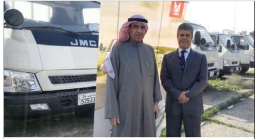
أوتوماك تسلم وزارة الكهرباء والماء شاحنات «جيه أم سي»

والتي جانب الوكالة الحصرية للعلامة التجارية (JMC) تمتلك «أوتوماك» محفظة واسعة من الوكالات وصولاً إلى شاحنات 6,5 اطنان، وذلك بهدف تلبية جميع احتياجات العملاء وفق مواصفات عالمية من خلال تقديم منتجات ذات مستوى عالمي تعتمد على أحدث التكنولوجيات المتكثرة ومعايير الخدمة المضمونة، الأمر الذي حول (JMC) العريقة، إلى شريك