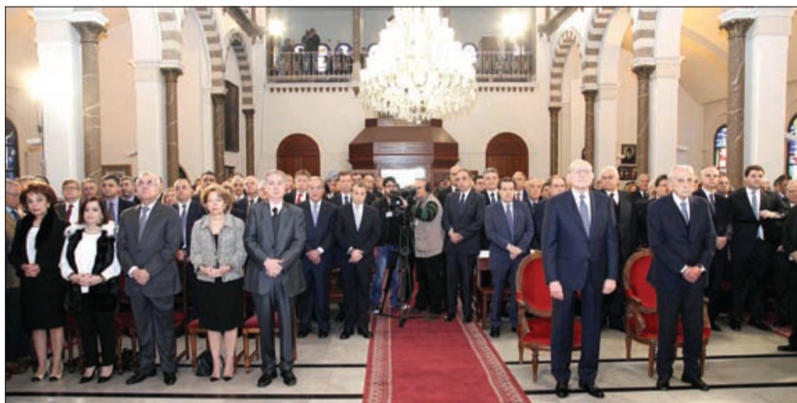
جانب من الحضور الرسمي في قداس عيد مار مارون بغياب رئيس الجمهورية للعام الثاني أمس