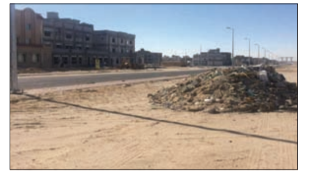
أكوام من الأنقاض تحيط بالمدينة