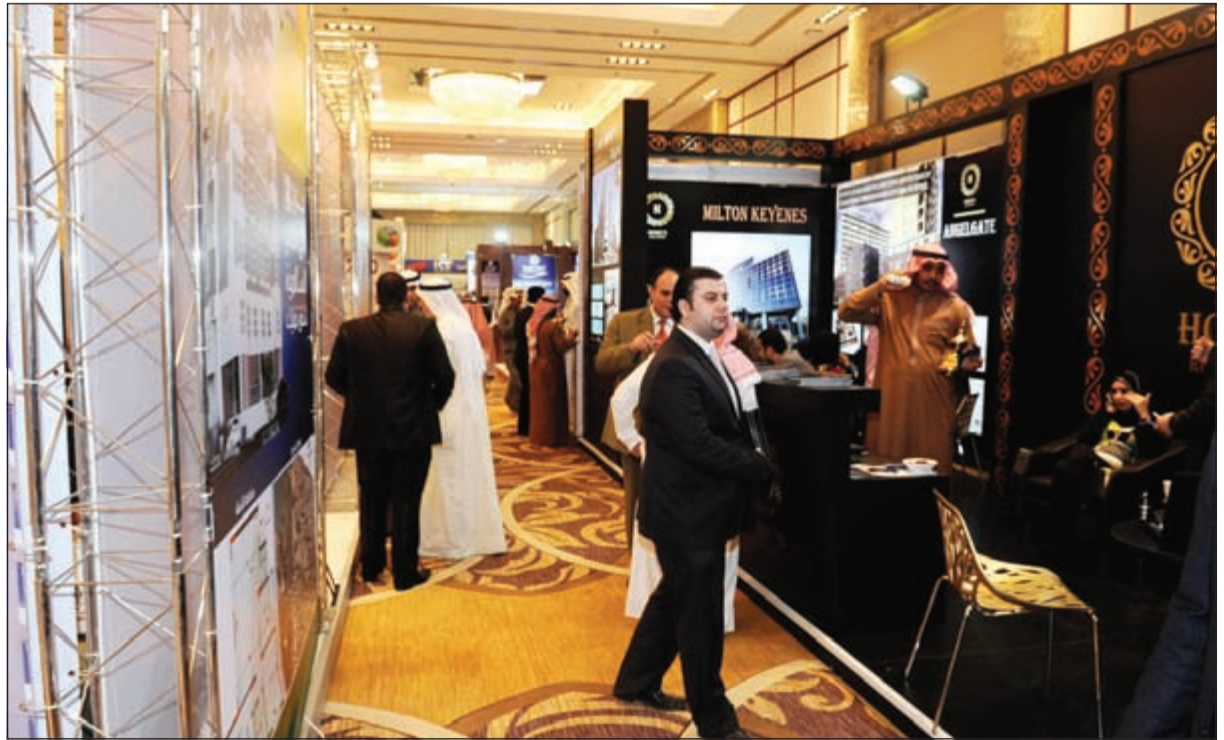
معرض «فبراير العقاري» 2015 سجل إقبالا جماهيريا