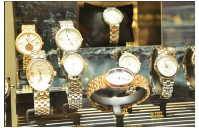
ساعات من أشهر الماركات

عملاتها واحترام حساسياتهم الثقافية، وتلبية كل حاجاتهم ومتطلباتهم، وكل ذلك مع خدمات عالية المستوى تقدم من قبل خبراء محترفين. وتمتلك مجموعة بهبهاني حاليا صالات عرض في مجمع الصالحي، سوق شرق، الأقيونز مول، الكوت مول، ليلي غاليري، مول 360، مارينا مول والحمران لاجيري سنتر، بالإضافة إلى أحدث صالاتها في «غيت مول». هاتف: 22056366