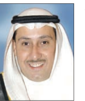
الشيخ فيصل الحمود

هذا، ويتزامن مع الاستقلال 55 هذا العام مع بدء احتفالات الكويت بأعيادها الوطنية «الاستقلال والتحرير» إلى جانب مناسبات وطنية عزيزة على قلوب الكويتيين كموطنين حيث تأتي هذه الاحتفالات لتتوج بمرور الذكرى العاشرة لتولي صاحب السمو الأمير الشيخ صباح الأحمد مسند الإمارة وتسلم سموه مقاليد الحكم في بلدنا المعطاء، إضافة إلى احتفالية الكويت «عاصمة للثقافة الإسلامية» 2016، كما كان للكويت نصيب كبير باختيارها مركزاً للعمل الإنساني ببيل أميرها لقب قائد العمل الإنساني، حيث دأب سموه منذ توليه على أن تكون الكويت سباقة في دعم المساعدات الخيرية الإنسانية.