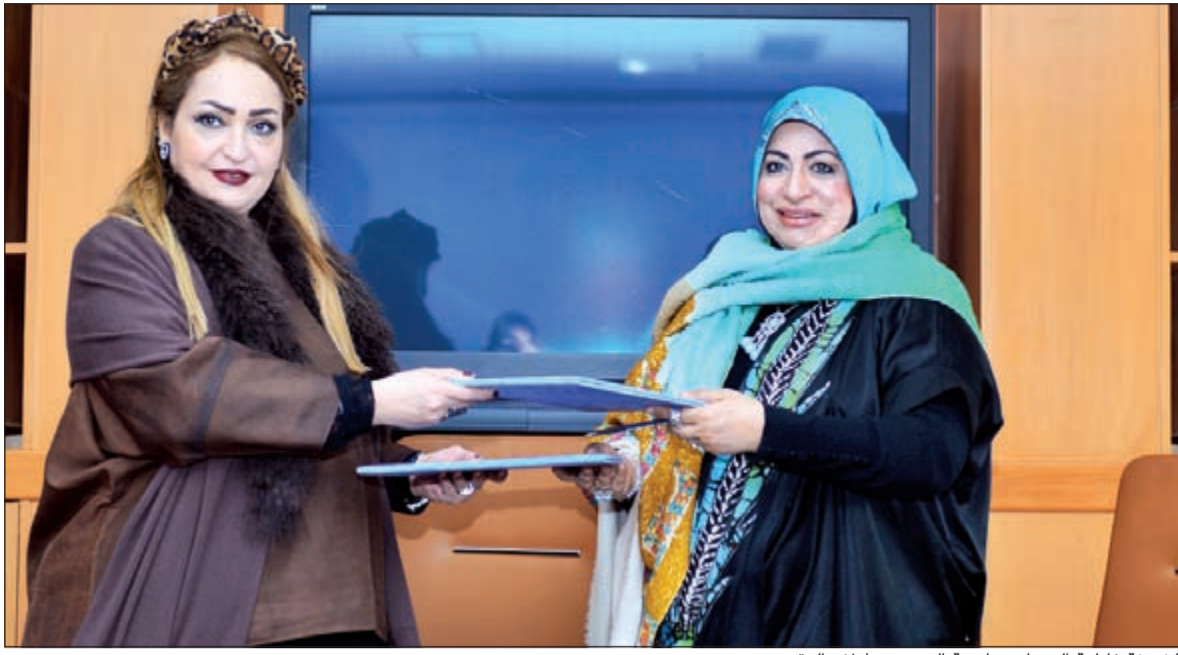
الشيخة فاطمة الصباح وباسمة الدهيم تتبادلان العقود