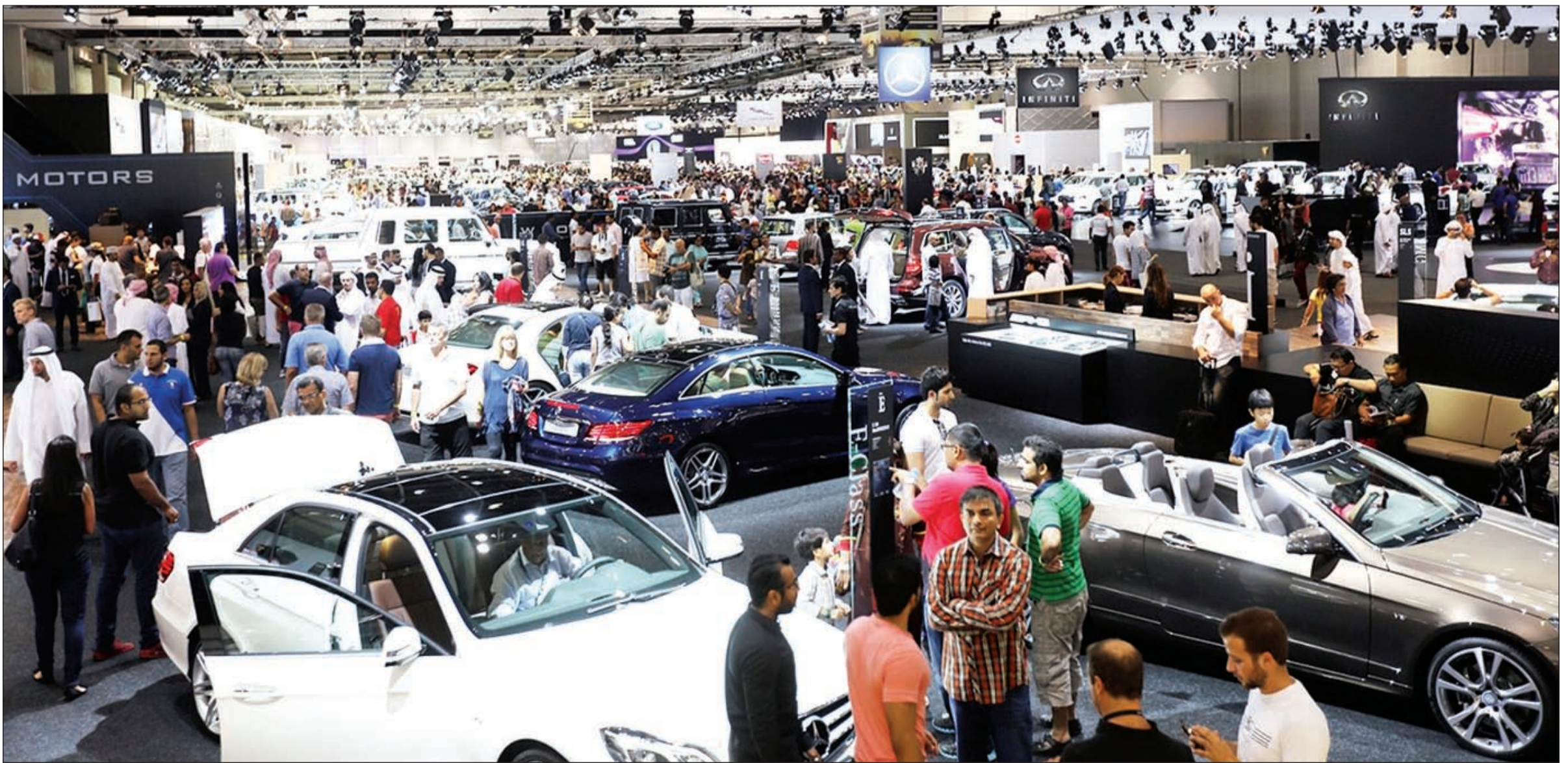
إقبال جماهيري كبير على معارض السيارات

وأعربت الصباح عن سعادتها بالمعرض الذي ستنظمه المجموعة تحت اسم معرض الكويت الدولي للسيارات على أرض المعارض الدولية بمشرف، وذلك لما تمتاز به قاعات أرض المعارض الدولية من إمكانات كبيرة سواء على صعيد المساحات الواسعة أو موافق السيارات الراحية، ناهيك عن مدى الإقبال الكبير الذي تشهده أرض المعارض من قبل مختلف فئات المواطنين والمقيمين، مؤكدة ان هذا المعرض يندرج ضمن المعارض