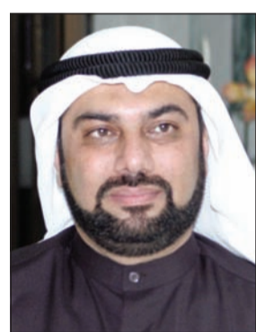
د. يوسف الزلزلة

ولن يكون هناك رفع للدعم عن أي سلعة باستثناء البنزين والكهرباء وأنه لا مساس بمنحة الزواج والقرض الإسكاني ولا المساعدات الاجتماعية القانونية. وزاد: ستتصدي لتوجه «المالية» إلى تخفيض ميزانية التوظيف من دون وضع خطة لاستيعاب الخريجين، وأطلب بإلغاء ميزانية الثريات المخصصة لمكاتب الوزراء والوكلاء لشراء الشوكولاتة والعطور والبخور والهدايا. وشدد على أن الهدر يكمن في السفر على الطائرات الخاصة التي تكلف الدولة مبالغ طائلة طوال مدة المهمات الرسمية ونفقات الوفود والطواقم. وطالب بالتعديل الوزاري لأن 75٪ من الوزراء لا يفقهون في المال والاقتصاد في هذه المرحلة الحرجة. وأكد أن سعر ليتر البنزين الممتاز 85 فلساً، والخصوصي 105 فلوس، والانترا 115 فلساً.