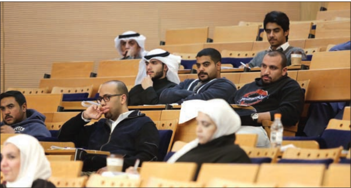
..وطلبة يستمعون الى المحاضرات

وأضاف أن الدورة تمكن من صقل قدرات المدرب في الجوانب الفنية المتعلقة