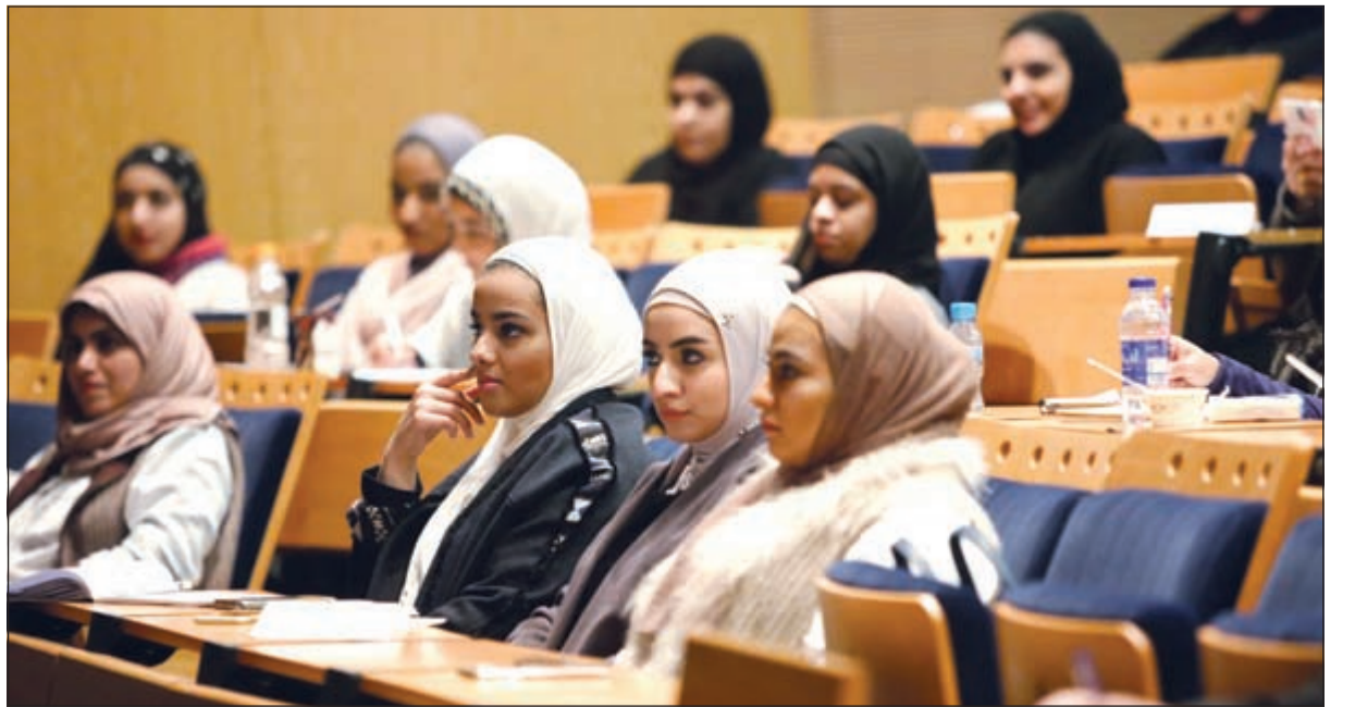
عدد من الطالبات خلال الدورة التدريبية