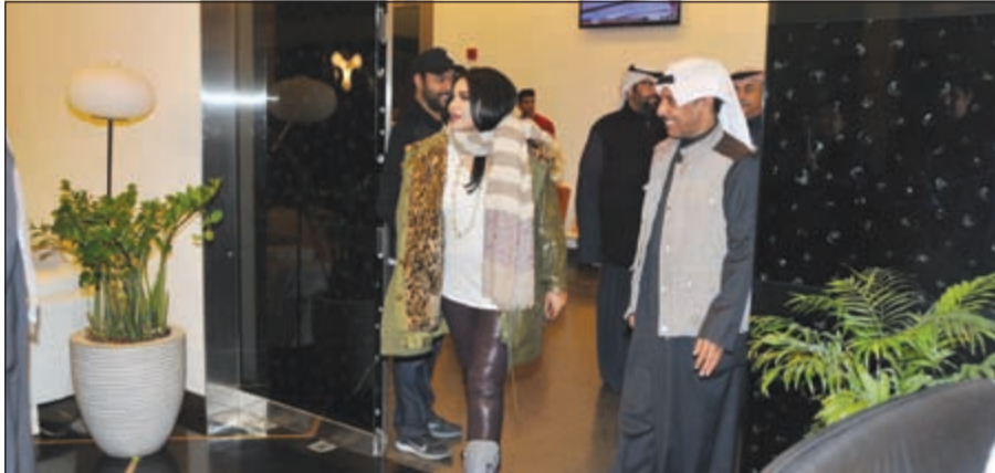
احلام لحظة وصولها لمطار الشيخ سعدالعبده

وابلغت الملكة احلام والملكة احلام صاحب السمو الامير بمرور عشر سنوات على توليه مقاليد الحكم، متمنية لسموه الصحة والعافية والعمر المديد، كما هنأت الشعب الكويتي بالذكرى الـ 55 للعيد الوطني و25 عاما على التحرير، وذكرت انها سعيدة بالمشاركة في مهرجان هلا فبراير الذي اصبح من المهرجانات العربية العريقة، متمنية ان تكون دائما عند حسن الظن لدى جمهورها الكويتي الذي تعشقه «موت».