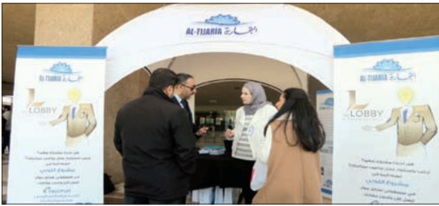
جانب من فعاليات اليوم المفتوح