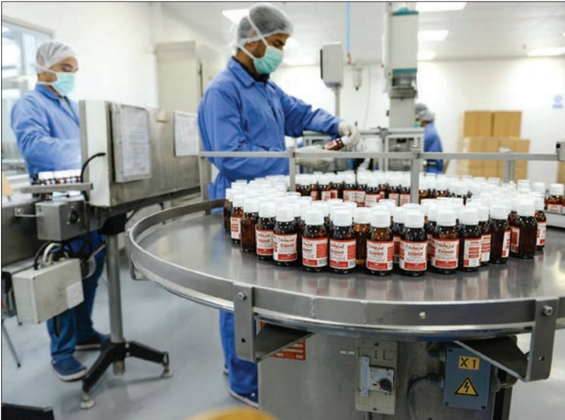
أحد خطوط إنتاج الدواء داخل شركة «الكويتية السعودية الدوائية»

أصناف الأدوية حتى الآن 225 دواء منها 75 صنفا من المحاليل الوريدية ومحاليل غسيل الكلى وغسيل الدم وكلها مخصصة من وزارة الصحة في الكويت ودول مجلس التعاون الخليجية والتسجيل المركزي بالمكتب التنفيذي لدول المجلس بالرياض حيث كلها مطابقة لكل معايير مراقبة الجودة