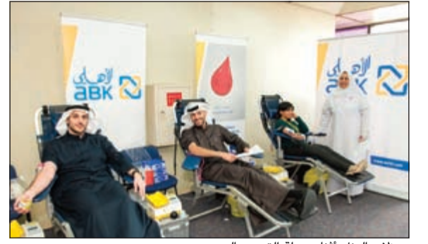
موظفو البنك أثناء حملة التبرع بالدم