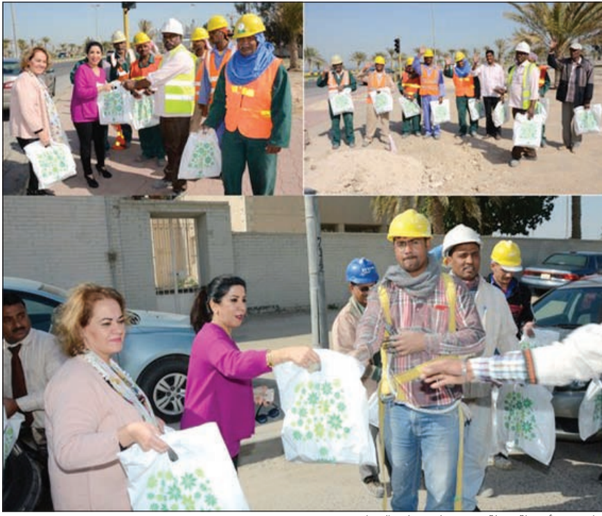
جانب من أنشطة حملة «هون عليهم» لـ «التجاري»

مبينة أن حملة «هون عليهم» مستمرة من خلال أجندة تهدف إلى ترتيب زيارات للأماكن التي يتواجد بها عمال النظافة والبناء وذلك في إطار مساعي البنك الدائمة لمد يد العون ومؤازرة فئات المجتمع كافة.