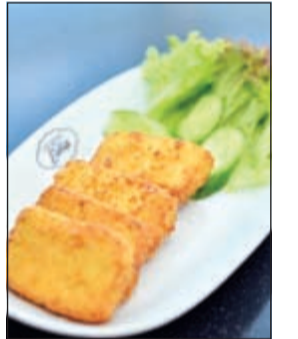
من الأطباق المقدمة

بعناية من أفضل المزارع والموردين، ونحرص على أن تكون طبيعية وخالية من أي مواد حافظة. إمرجان سوتيش يعتبر واحدا من أشهر المطاعم العالمية في دولة الكويت، وهو يحظى بالدعم اللازم من قبل شركة محمد ناصر الهاجري وأولاده، التي اتاحت الفرصة لأهل الكويت أن يجربوا النكهات التركية الأصيلة.