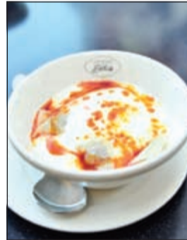
لذة الذوق التركي