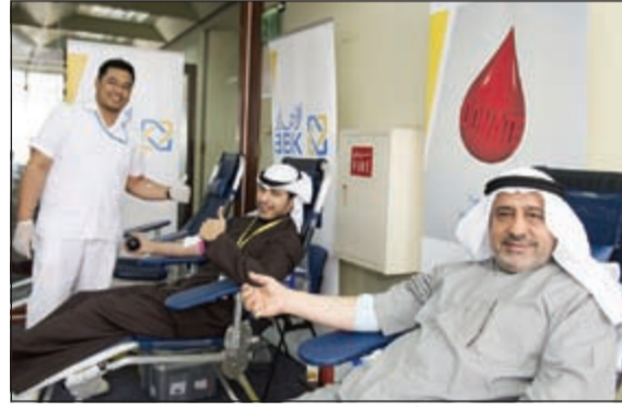
موظفو «الأهلي الكويتي» أثناء حملة التبرع بالدم

ولتشجيع الموظفين على العطاء للمجتمع، وفي إطار هذه الحملة السنوية، رعى البنك مؤخرا حملة مؤسسة «لويك» السنوية الرابعة للتبرع بالدم للمساهمة في زيادة وعي المجتمع بأهمية التبرع بالدم. وأشاد فريق بنك الدم المركزي بجهود البنك الأهلي الكويتي المستمرة ودعمه المتواصل لحملة التبرع بالدم. ويعتبر البنك الأهلي الكويتي مساهما فعلا في خدمة المجتمع والمسؤولية الاجتماعية.