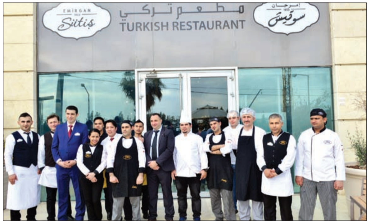
لقطة تذكارية لفريق عمل «إمرجان سوتيش»