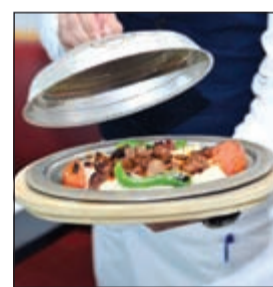
أشهى الأطباق المقدمة