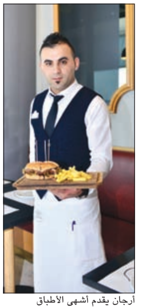
أرجان يقدم أشهى الأطباق