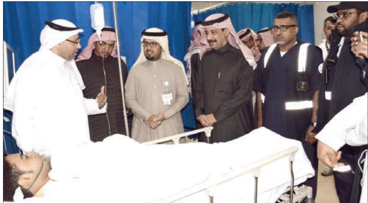
مدير عام الشؤون الصحية بالمنطقة الشرقية خلال اطمئنائه على حالة مصابي الحادث الإرهابي في الأحساء

الهدف إلى بث الفتنة والبلبلة وزعزعة أمن واستقرار هذا البلد العربي الشقيق والمس بسلامة مواطنيه والمقيمين به»، مؤكدة دعم الرباط، الثابت وتضامنها لكل محاولات زعزعة الاستقرار في جميع المجالات الخدمية والصحية والأمنية. ومن جانب آخر، تبنى تنظيم «داعش» الهجوم المنظم الذي استهدف أول 9 آخرين بينهم عدد من أفراد الشرطة النسائية، في أحدث عملية لتنظيم «داعش» هناك. وتأتي العملية بعد يوم واحد من استهداف بوابة القصر الرئاسي «معاشيق» في عدن بسيارة مفخخة في عملية أوقعت عددا من القتلى والجرحى، وتناها تنظيم داعش أيضا. في غضون ذلك، أكدت مصادر عسكرية لـ «الأنباء» أن قوات التحالف العربي تصدت أول من أمس لمحاولات تسلل جديدة للمتطرفين للتقدم نحو جبل الدود السعودي المتاخم لحدود محافظة صعده مع منطقة الحوبة بجازان على الشريط الحدودي وقتلت العشرات من ميليشيات الحوثيين وصالح.