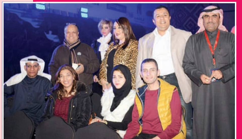
الزملاء الصحافيون أثناء تغطية الحفل الثاني لـ «هلا فبراير»