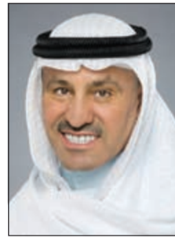
النائب محمد طنا

هاذي هي الجزيرة العربية وقبائلها سواء الحاضرة أو البادية وجميعهم سواء في الدم والاصل والفصل، اذا وبعد ترسيم الحدود والخير الوفير في جميع الدول الثلاث وتظهر الذبح الأسود النقط اصبح التنقل بين الدول فيه صعوبة لذلك انقسم أبناء الجزيرة بين هذه الدول فما يهمني هنا بلدي الكويت حيث بدأت القيادة السياسية ترغب في استقطاب أبناء القبائل لما عرف عنهم من امانة وشجاعة وولاء للدولة، سواء عن طريق اخوانهم من الحاضرة، كل يحضر أبناء قبيلته للتسجيل في الجيش والشرطة لتكوين مقومات الدولة، ومن ثم مساعدتهم في الحصول على الجنسية الكويتية، بل وكانوا يشهدون لهم في ملفات الجنسية، ووصل بالبعث من الحاضرة من الشيوخ ان ترسل الجنسية الى بعض القبائل في