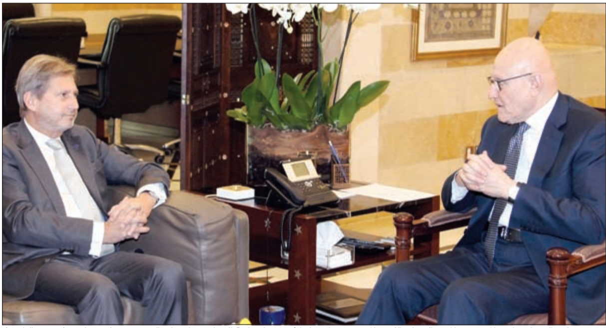
رئيس مجلس الوزراء تمام مستقبلا في السراي الكبير المفوض في الاتحاد الأوروبي لسياسة الجوار ومفاوضات التوسع جوهانس هان

حزب الله بعد لقاء معراب بتحميله مسؤولية حمل 8 آذار لانتخابه، وعمما اذا كان سيحاول التقريب بين حليفه، وقال: اكيد سيتكلمون مع بعض، لكن على مهلك، حصوله كان الغلط وليس العكس.