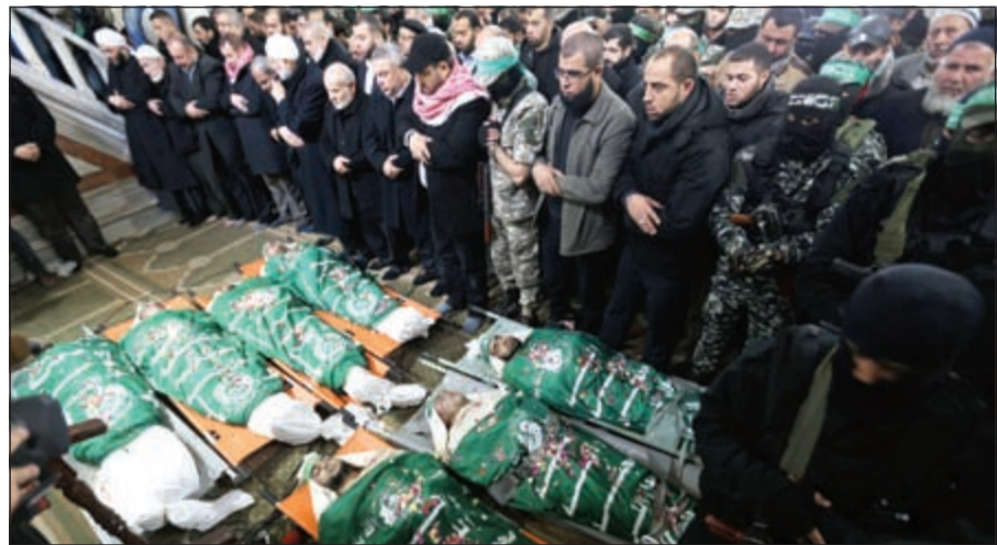
تشجيع جثامين سبعة شهداء من حركة حماس (أ.ف.ب)

موسكو - رويترز: وصف الكرملين تصريحات مسؤولين أمريكيين زعموا أن الرئيس الروسي فلاديمير بوتين فاسد بأنها مشينة ومهينة، مضيفاً أن هذه محاولة للتأثير على الانتخابات الرئاسية المقبلة. وقال المتحدث باسم البيت الأبيض: إن تصريحات أنلي بها مسؤول بوزارة الخزانة الأميركية في وقت سابق زعم فيها أن بوتين فاسد تعكس رؤية الإدارة الأميركية. وقال ديمتري بيسكوف المتحدث باسم بوتين في إشارة لتصريحات البيت الأبيض «هذه التصريحات مشينة ومهينة». وتابع بقوله «بشكل عام نرى أنهم بالخارج بدأوا يعدون للانتخابات الرئاسية الروسية التي لا يزال أمامها أكثر من عامين».