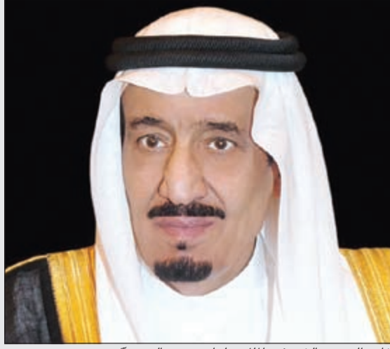
خادم الحرمين الشريفين الملك سلمان بن عبدالعزيز آل سعود

واستحقاق. يذكر أن الغانم اعترض في مداخلة له أمام مؤتمر البرلمانات الإسلامية الذي عقد في بغداد مؤخراً على ما جاء في كلمة لاريجاني بحق المملكة العربية السعودية قائلاً: اسجل اعتراضي على ما جاء في كلمة د.علي لاريجاني بشأن المملكة العربية السعودية واعتبره تدخلاً في الشؤون الداخلية للمملكة وأنه إذا كان الوفد السعودي غائباً فاننا شخصياً والوفد الكويتي نتمثل السعودية هنا.