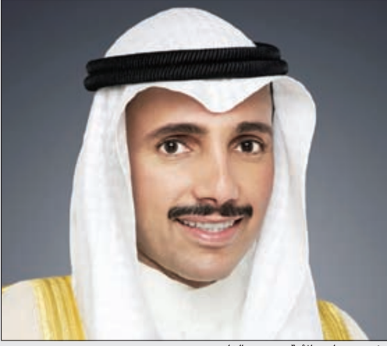
رئيس مجلس الأمة موزون الغانم